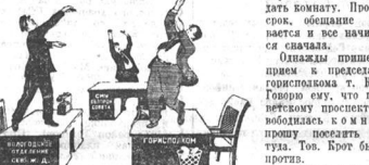
Рис. П. Виноградова.