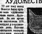
Ни снимки: тематическое кружево - работы Е. Самаринской