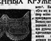
Ни снимки: тематическое кружево - работы Е. Самаринской