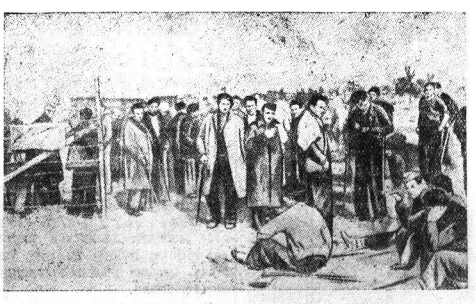
Немедленно по прибытии на французскую территорию, захваченные из Каталонии бойцы испанской республиканской армии разоружаются и интернируются французскими властями в особые лагеря. НА СНИМКЕ: бойцы республиканской армии в лагере, расположенном на франко-испанской границе в Аржеас-сюр-Мер.

ПРАГА, 17 февраля. Составление нового венгерского правительства поручено бывшему министру просвещения и культав Тедеки, который занял пост премьер-министра. Пост министра просвещения и культав занял Хомпа (бывший министр просвещения и культав в кабинете Дараньи). Остальные министры остались на своих постах.