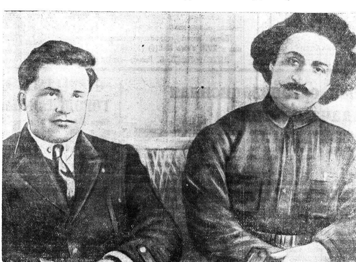
18 февраля исполняется два года со дня смерти тов. Г. К. Орджоникидзе.

«Мы, коммунисты,— люди особого склада. Мы строим из особого материала. Мы—те, которые составляют армию великого пролетарского стратега, армию товарища Ленина. Нет ничего выше,