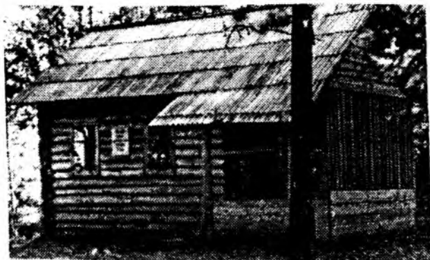
Дом на Бобришном угоре

В сороковые, пятидесятые годы Яшин как и раньше оказывается на переднем плане событий, ездит на "стройки коммунизма", на целину, стараясь все увиденное использовать в