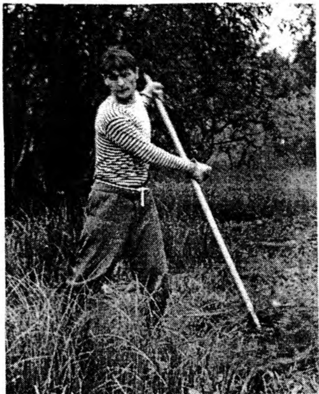
А. Яшин на сенокосе у реки Юг. 1963 г.

Тяжело переживая свое состояние, Яшин говорит о "разрыве, наметившемся между поэтическим изображением жизни и её подлинностью". "Вот главное преступление нашего времени - люди перестают доверять друг другу", - так он характеризовал атмосферу в обществе. Стихи последних лет становятся всё более исповедальными, философски-глубокими, мудрыми. В пятидесятые-шестидесятые годы Яшин много работает и над прозой. И здесь он остаётся верен своим убеждениям, несмотря ни на какие гонения. В этом и состоит его подвиг - понимание своей литературной работы как служение людям. Об этом его стихотворение: "Я обречён на подвиг..." Как бы не отличались друг от друга ранние и поздние стихотворения - всё это одна "книга жизни", книга творчества Яшина, и вся она объединена, пронизана необыкновенной его любовью к родной земле, вологодчине. За веру и отечество шли умирать русские люди во все века.