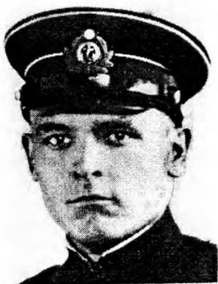
А. Яшин на Волжской Военной флотилии 1942г.

творчестве, говоря правду так, как он ее тогда понимал. Это время идейно-социальных заказов, как он с горечью позже говорил сам: "приказчичьих стихов". Позднее он напишет об этом так: "До чего ж мы были просты С нашей верою беспросветной, С нашей преданностью несусветной, Доходившей до слепоты!". "Поэзии вне времени не существует", - замечает он, и поэтому, конечно, его творчество, лишенное свободы слова, тесно связано со временем, которое он называл "жесточкой двуликой эпохой". "В те года рифмы своеобразные, Не в меру лиричное слово Воспринималось как неприличие, А местоимение личное - Как посягательство на основы". В 1947 г. из-за этого был рассыпан уже набранный сборник лирики "Живая вода". Сохранился единственный экземпляр, хранящийся в Российской Государственной библиотеке. Но уже в середине 50-х годов его лирическая поэзия приобретает ярко социальную, гражданственную окраску. Пережив "переходный возраст" и осознав весь трагизм происходящего, он писал: "За все отвечать настала пора: За то, что когда-то я промолчал, За то, что кричал во весь рот ура, А караул не кричал". Первая книга стихов, знаменующая новый период в его творчестве была "Совесь". "Это плод моего переходного возраста, она выстрадана, а не сочинена", - писал он. С этого времени правда, совесть, а она как известно - глас Божий в человеке - стали как бы девизом творчества Яшина. "Всё во имя совести, Всё во имя чести, Всё - от первой повести до последней песни".