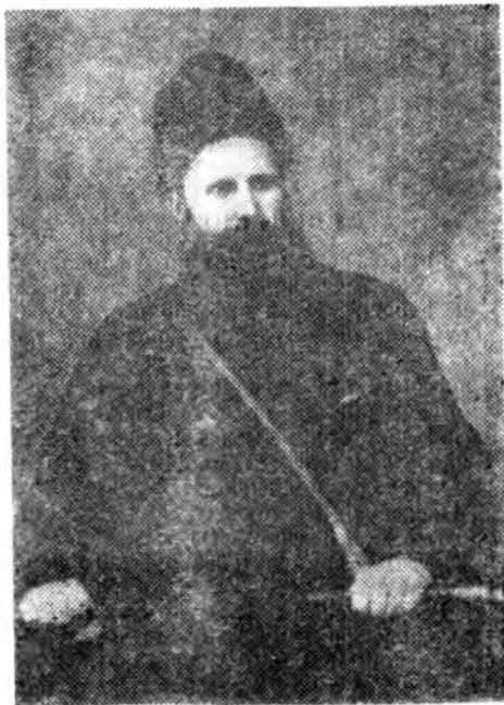
На снимке: В. В. ВЕРЕЩАГИН.

Однажды потребовалось узнать, не готовят ли новый штурм притихшие за крепостной стеной колонны осаждающих. Но никто не решался пойти на верную гибель. Тогда Василий Верещагин, забравшись на стену, выпрямился во весь рост, чтобы глянуть вниз. И только успел спрятаться, как десятки пуль ударили по стене.