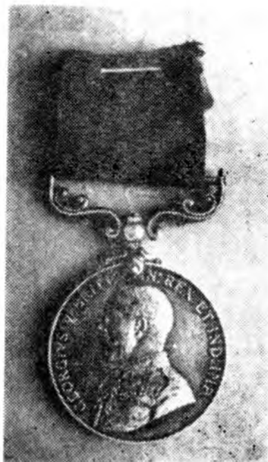
На снимках: С. Ф. Вантеев; его английская медаль