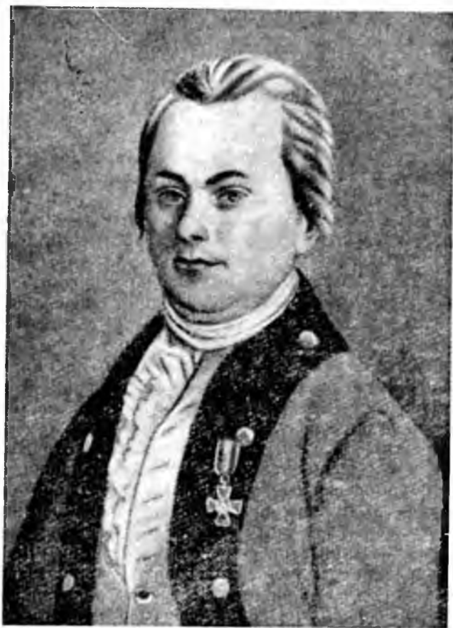
И. И. Лепехин

1759 года поступить в академический университет, где он слушал лекции лучших русских ученых-академиков по различным отраслям науки, особенно увлекаясь химией. Учился Лепехин прекрасно, и уже в сентябре 1762 года для завершения образования и приобретения ученой степени он был отправлен Академией за границу—в Страсбург. В Страсбургском университете, помимо занятий на медицинском факультете, он слушал лекции