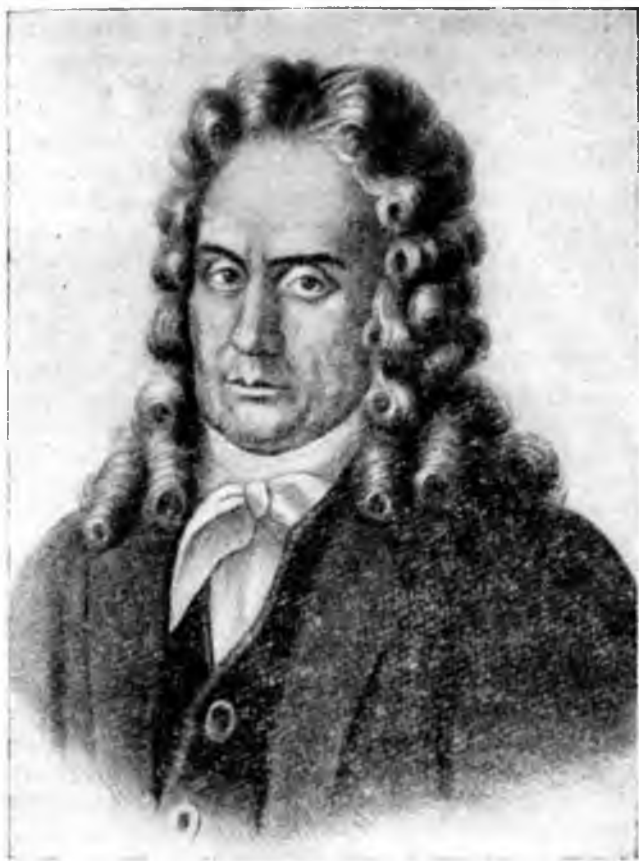
Л. Л. Блюментрост

Крупный ученый и выдающийся врач, Блюментрост выступил активным сторонником создания на базе Марциальных вод первого в России курорта. Он произвел химический анализ источника и подтвердил его целебные свойства. Имеются сведения, что Блюментростом была написана в этой связи специальная работа, однако полностью она опубликована не была, и мы знаем о ней только по переписке.