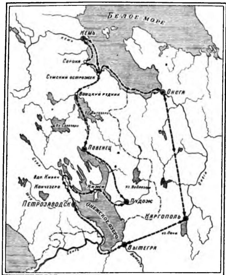
Маршрут поездки Г. Р. Державина в 1785 году