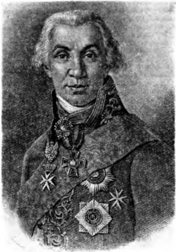
Г. Р. Державин

для проверки состояния судопроизводства в различных городах, Державин указывал им на необходимость «получить от обращения с тамошними градскими жителями или поселянами... нужные для топографического описания сведения. А притом, ежели от кого что узнаете или сами заметите касательно до исторического известия о происхождении того края, народов, о древних приключениях, об обычаях и нравах, или любопытные