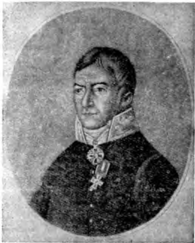
В. М. Севергин

открыть, что время и случай показать может». В числе «главных естественных произведений» края (т. е. природных богатств — В. П.) Севергин особо отмечает «карельскую березу, на многие изящные поделки употребляемую».