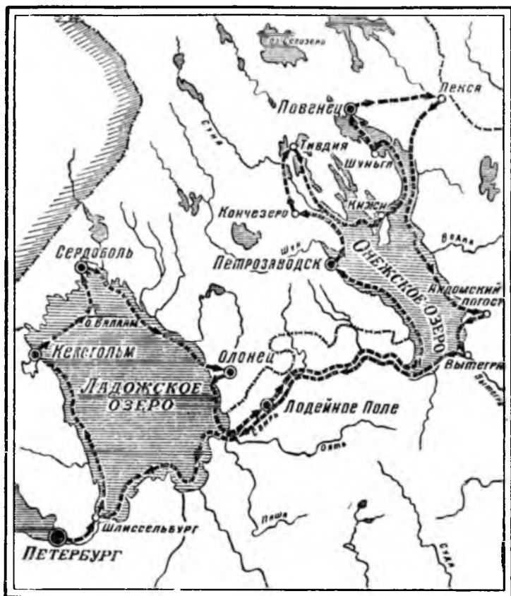
Маршрут экспедиции Н. Я. Озерцковского 1785 года

ные, экономические и помещичьи», — пишет он о населении Шуйского погоста (под Петрозаводском).