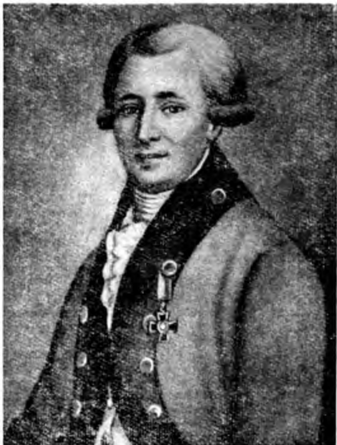
Н. Я. Озерецковский

Благодаря своим способностям Озерецковский уже в первой экспедиции получает от Лепехина задания самостоятельно, во главе небольшого отряда, исследовать тот или иной район. Первый такой маршрут Озерецковский проделал весной-летом 1769 года в Саратов и его окрестности. Зимой 1771 года он возглавлял передовой отряд, посланный Лепехиным из Тюмени