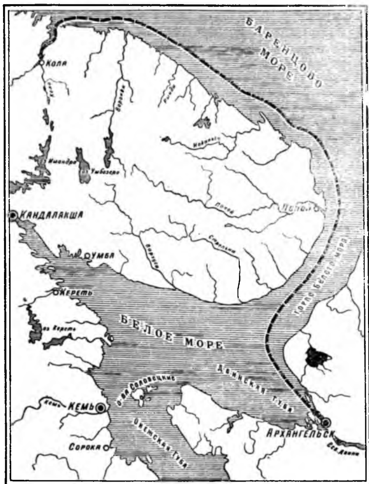
Маршрут самостоятельной поездки Н. Я. Озерецковского в составе экспедиции И. И. Лепехина в 1772 году

писал он,— в 1771 году лишился я всей моей собственности в Ледовитом океане, в 1773 году погорел в Великих Луках, в 1814 году в озере Ильмень потонули остатки моих пожитков».