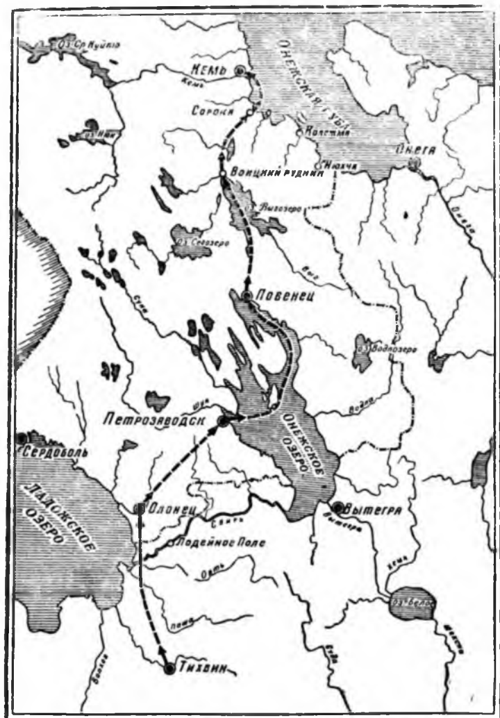
Маршрут второй поездки Э. Лаксмана в 1779 году