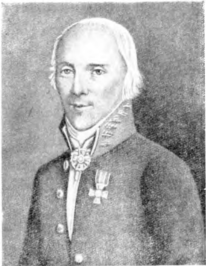
П. Б. Иноходцев

мии, Иноходцев во время поездок собрал и систематизировал громадный фактический материал по другим отраслям знания. На основании этого обширного материала им написано и опубликовано около 100 трудов и заметок. Обработкой своих полевых наблюдений ученый и занимался в последние годы жизни. Умер Иноходцев в 1806 году.