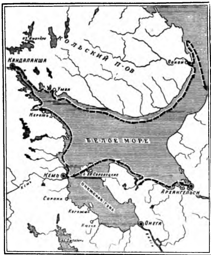
Маршрут экспедиции И. И. Лепехина в 1772 году

страны изобилуют высокою металлов породою, примером Медвежьего острова и Трех островов» 15 .