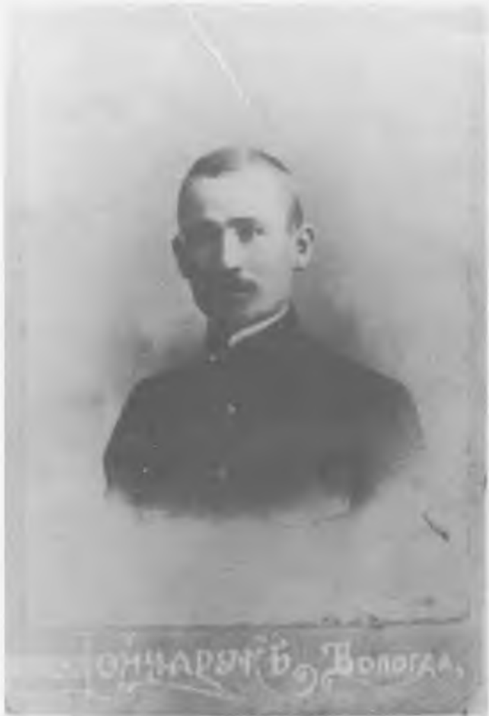
Алексей Семенович Сидоров — 1910-е годы.