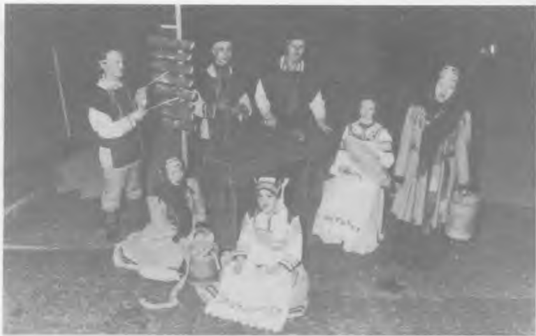
Музыкальное оформление спектакля.