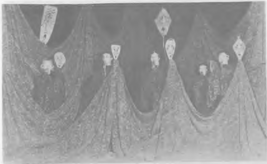
Сцена песни леса.