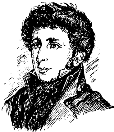
К. Н. БАТЮШКОВ (1787—1855)

В ста верстах от Вологды, в одном из глухих углов Чёреповецкого уезда, в начале XIX века находилось сельцо Хантоново. Невдалеке от реки, в густой зелени, расположился господский дом с балконом, садом и беседкой. Село было небогатое. Барский дом—ветхий, готовый развалиться. Имение это принадлежало старинной вологодской дворянке Александре Григорьевне Батюшковой, урождённой Бердяевой. В этом домике своей матери провёл значительную часть сознательной творческой жизни видный русский поэт начала XIX века К. Н. Батюшков. Здесь он переживал минуты творческого подъёма, здесь работал над своими лучшими элегиями, сатирами, дружескими посланиями. Здесь вызревали его новые творческие планы. И не удивительно, что Хантоново с его безыскусственной сельской про-