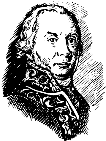
М. Н. МУРАВЬЕВ (1757—1807)

О тец двух декабристов—Никиты и Александра Муравьёвых—вологжанин Михаил Никитич Муравьёв был известным писателем XVIII столетия, одним из ранних представителей русского дворянского сентиментализма.