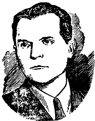
А. Я. ЯШИН

Я считаю своей особой поэтической удачей, — пишет лауреат Сталинской премии Александр Яшин, — что... моим любимым местом на земле оказался Север, Вологодская и Архангельская области. Здесь много своеобразия в природе, в производственной жизни людей, в их быте и языке. Через свой родной Север мне легче было почувствовать мощь нашей великой Родины и её великого русского народа...» 1)