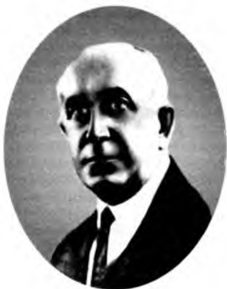
Акад. В. Н. Сукачев

Вторую ботаническую кафедру - морфологии, систематики и дендрологии возглавлял будущий основоположник лесной биогеоценологии, член-корреспондент АН СССР и Чехословацкой земледельческой академии (1921) проф. В.Н. СУКАЧЕВ.