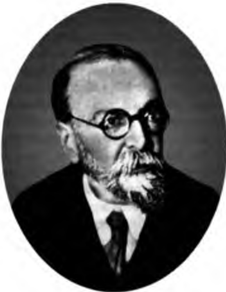
Проф. М. Н. Римский-Корсаков

На лесохозяйственном факультете читался курс энтомологии, на охотоведческом отделении - зоологии. Чтение зоологии на основной лесохозяйственной специальности еще ранее из учебного плана оказалось исключенным.