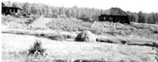
Починок Ляленка. Дом С. Вылегжанина (справа). 1969.