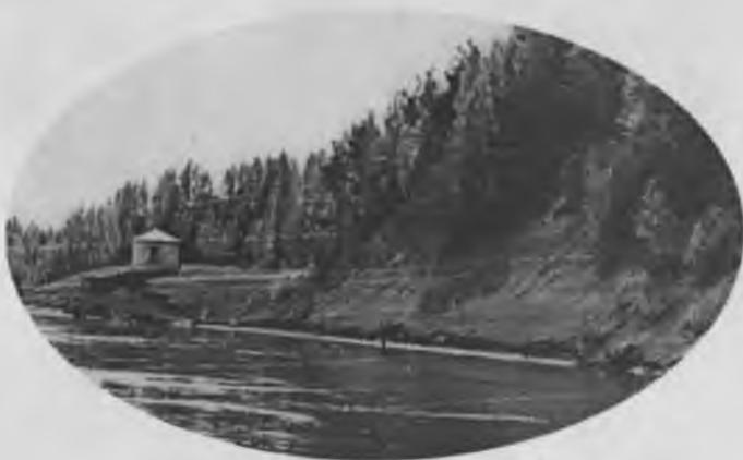
Пароходная пристань «Варнавино» на р Ветлуге. 1971.

<<... по лесам, в окрестностях Ветлуги...>>