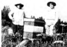
Пчеловоды на Ляленке. Лето 1969 г.