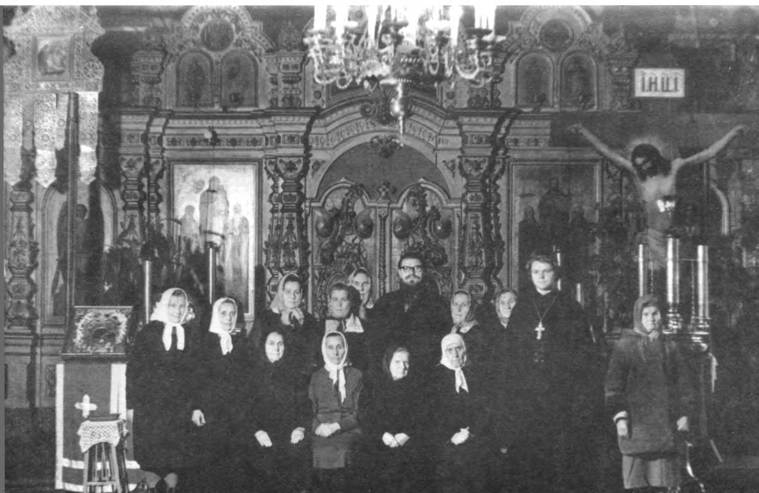
Приходской совет, 1977 г.