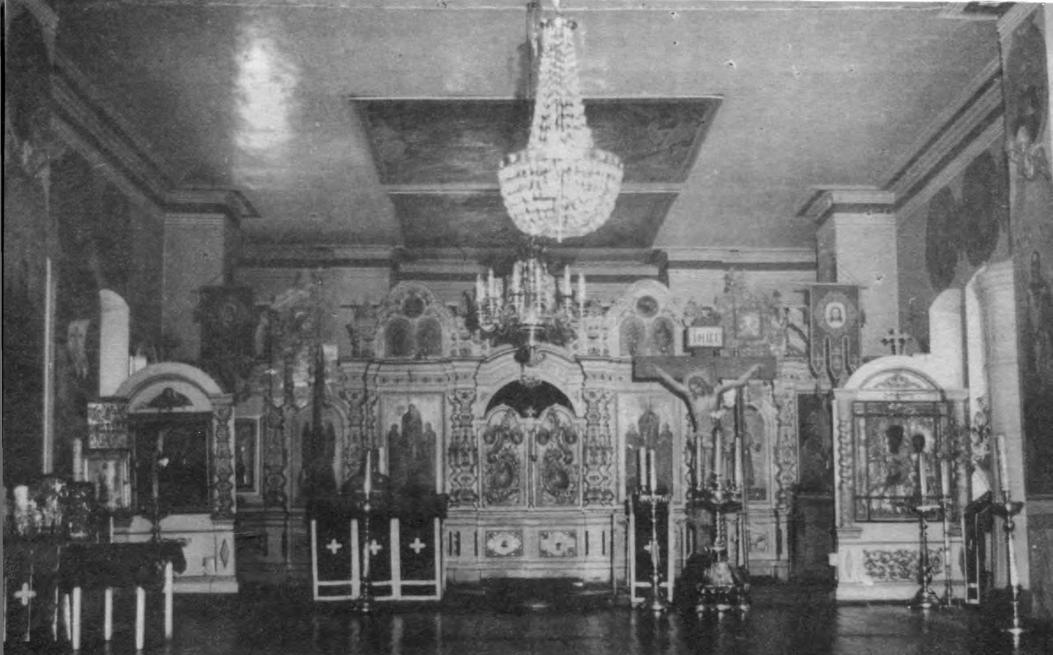
Внутренний вид церкви, 1970-е гг.