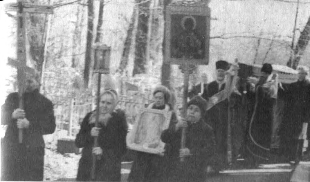
Крестный ход с мощами прп. Феодосия Тотемского, 29.4.1988 г.