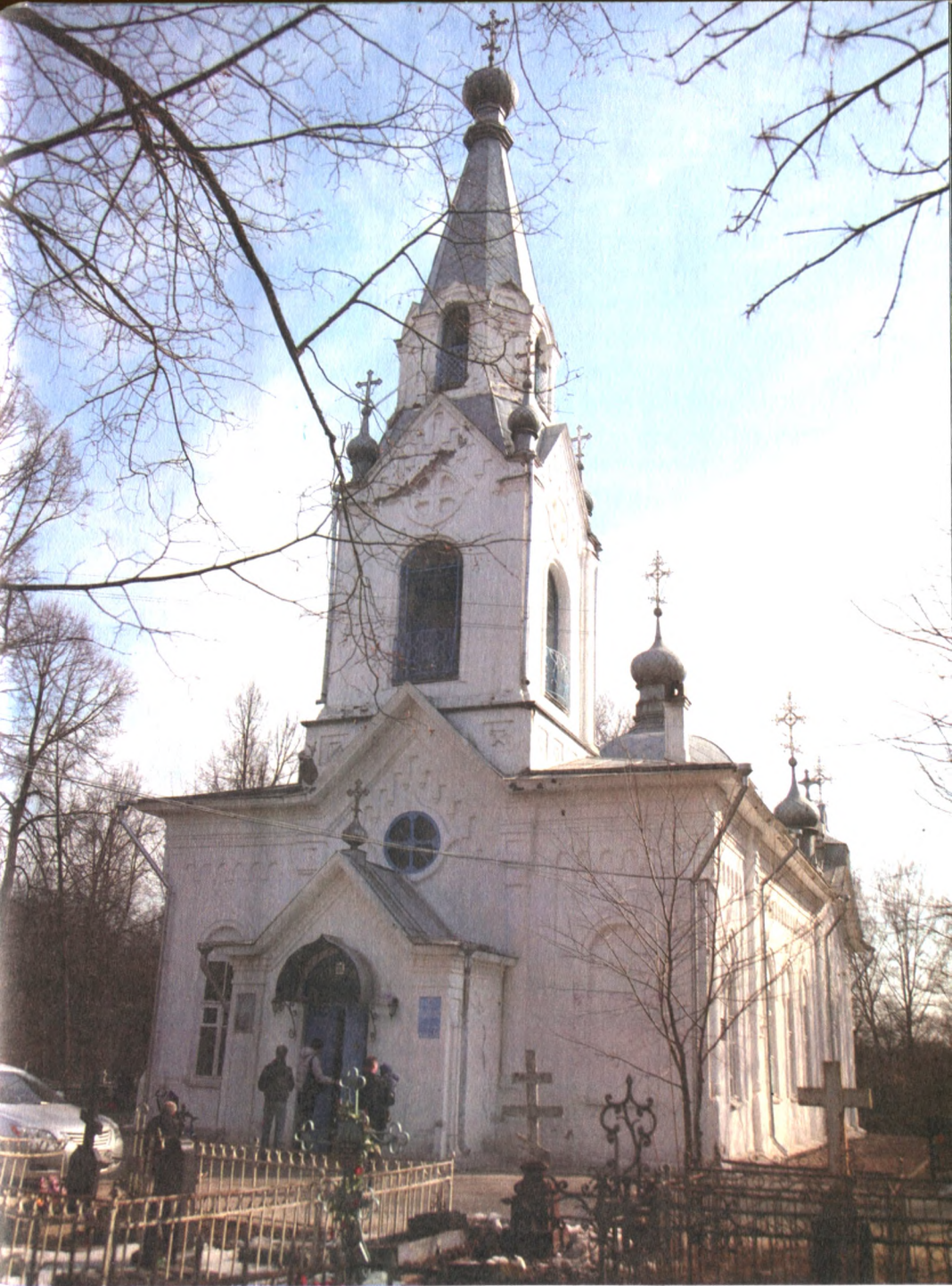
Вид храма, 1990-е гг.