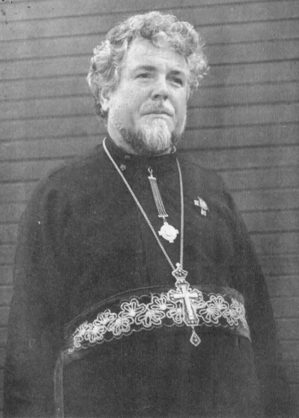
Протоиерей Владимир Завальнюк, 1980-е гг.