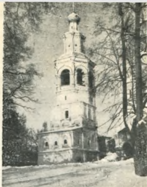
Соборная колокольня (XVII—XVIII в.).

редкий тип двухстолпного храма с асимметричным построением архитектурных масс. Небольшая колокольня при Вознесенской церкви с хорошо выдержанными пропорциями была создана в XVII веке. Она реставрирована в 1959—1960 годы.