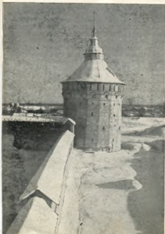
Юго-западная башня (XVII в.).

Крепость в плане представляет неправильный четырехугольник с прямыми стенами и с большим выносом башен. Длина стен 870 м, средняя высота 7 м, высота южных башен с кровлями более 34 м. Декор башен смягчает суровость крепостных стен. Панорама монастыря со стороны реки производит впечат-