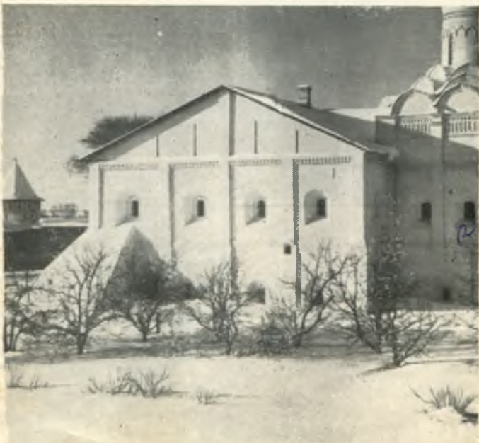
Трапезная палата (середина XVI в.).

Главные врата монастыря с Вознесенской церковью возведены к 1590 году. Надвратная церковь —