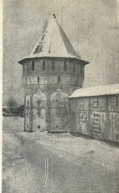
Мельничная башня (XVII в.).

сделан сей град около Прилуцкого монастыря, монастырскою казною...», но скорее всего к 1656 году закончен был какой-то этап по строительству крепости. Документы свидетельствуют, что начало работ было положено в 1644 году, а последние сведения о строительстве стен встречаются под 1671 год.