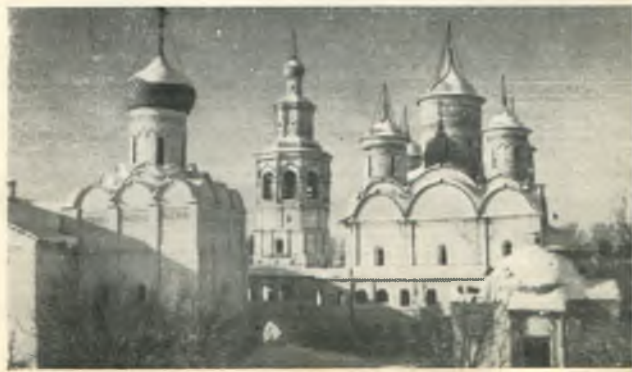
Ансамбль монастырских зданий, вид с юга.

В XVII веке все монастырские строения были обнесены мощной каменной стеной с башнями. Это превратило монастырь в сильную крепость Севера. На закладной доске, в стене Надвратной церкви имеется надпись: «Лета 7164 (1656), августа в 1 день