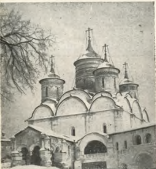
Спасо-Преображенский собор (1537—1542).

К 1654 году рядом с древней колокольной, созданной в XVI веке, появилась новая, больших размеров. В XVIII веке она перестраивалась. Новая колокольня относится к типу «русских построек «восьмерик на четверике». Декоративное богатство старочного яруса звона усиливается за счет контраста