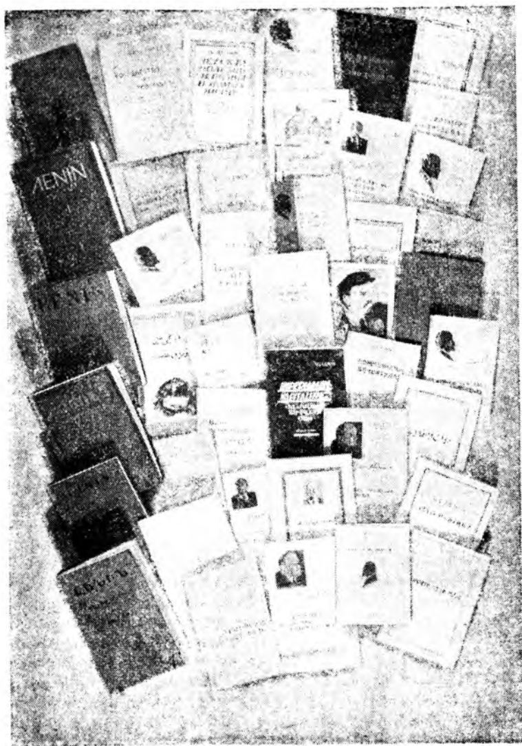
Произведения В. И. Ленина на языках народов СССР