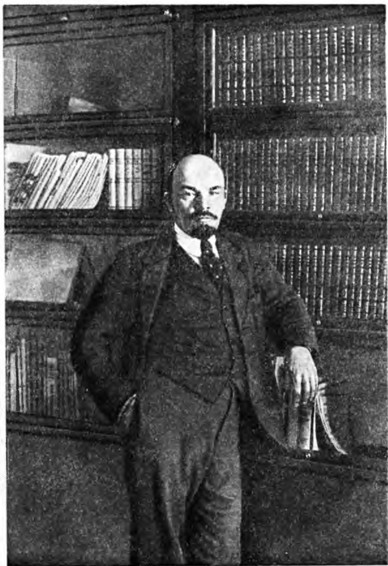
В. И. Ленин в рабочем кабинете в Кремле (1920 г.)