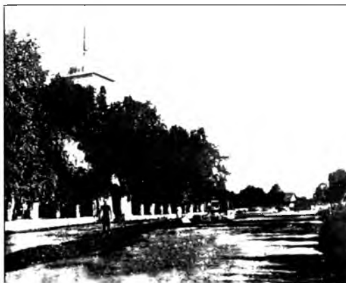
На первом снимке видна центральная площадь у церкви, снятая с северной стороны главной улицы

На втором снимке изображена та же площадь у церкви, но снятая с южной стороны главной улицы.