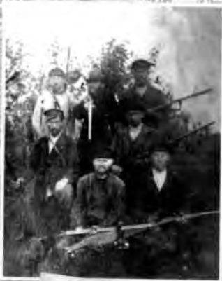
Охотники села Ольхово