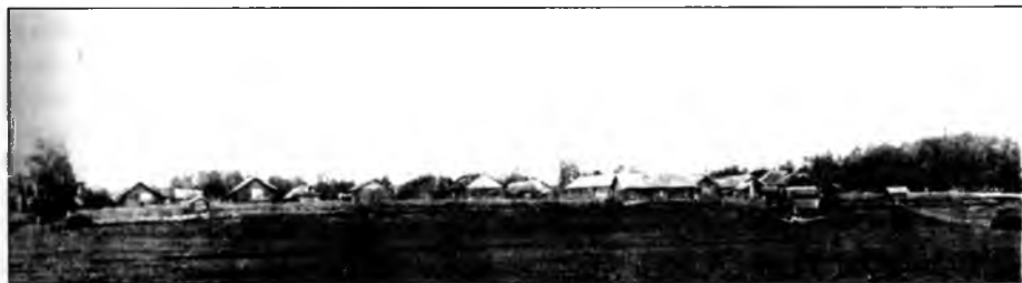
Общий вид села Ольхово с восточной стороны. Снимок сделан в 1933 году

останавливается. Однако эта далеко неравная борьба двух сил заканчивается всегда в пользу ледохода. Лед, остановившийся в излучине реки, подталкивается все новыми и новыми мощными пластами, плывущими сверху реки, и ледоход вновь и вновь со страшной, нарастающей силой, с шумом и ревом продолжает развиваться. Ледоход проходит несколько дней с одновременным прибыванием воды, которая заполняет буквально на глазах огромные окрестные пространства. В наших краях разлив воды, при больших паводках, простирается по пойме на расстояния до 20-25 верст в правую и левую сторону реки. Паводок приносит на затопляемые земли неоценимый удобрительный материал ил, источник роста прекрасной