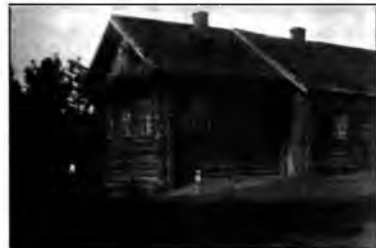
Дом Палановых в Ольхово

В Пшеничице я ездил на каникулы вплоть до окончания школы в 1972-м. У деда с бабушкой было 4 дочери, но лишь одна из них, моя мать, родилась в Ольхово и достаточно долго (1928-1940)