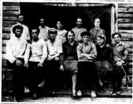
Активисты с. Ольхово