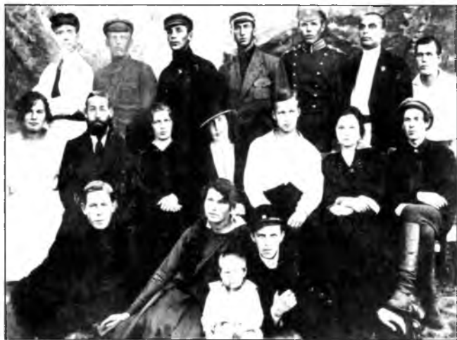
Труппа актеров-любителей, принимавших участие в спектакле по пьесе "Враги"