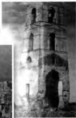
Колокольня с. Ольхово