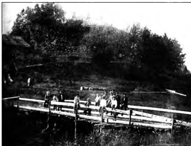
Вид на здание школы с юга (со стороны правого берега реки Шексны).