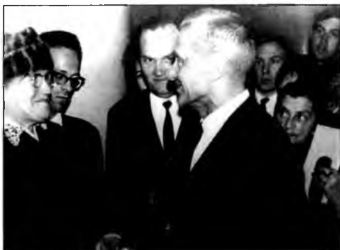
В Московском университете после прочитанной публичной лекции на тему: «Проблемы человека».

хирургии института имени Ф. Т. Яновского. Член-корреспондент академии медицинских наук. Депутат Верховного Совета СССР трех созывов. Лауреат Ленинской премии. Награжден многими орденами и медалями. В 1973 году Амосову Н.М. присвоено звание Героя Социалистического труда и вручена медаль «Золотая Звезда». Амосова Н.М. поистине и по праву называют светилом в области хирургии грудной клетки. С его именем впервые в нашей стране связано протезирование митрального клапана сердца. Он успешно использует современную кибернетику в области медицины. Имя Амосова Н.М. широко известно не только в нашей стране, но и далеко за ее пределами.