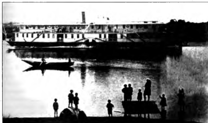
Пассажирский пароход «Гидротехник», плывущий вниз по течению р. Шексны около с. Ольхово с западной стороны. Снимок сделан в 1933 году