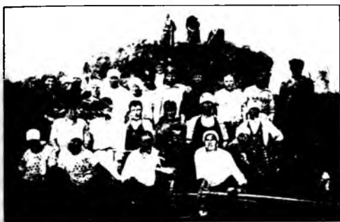
На данной фотоснимке, относящемся к тридцатым годам, запечатлен момент кратковременного отдыха бригады колхоза «Искра», работающей на уборке сена

которые за этот период развились и окрепли. В наши селения пришла новая жизнь, строящаяся на справедливых социалистических принципах.