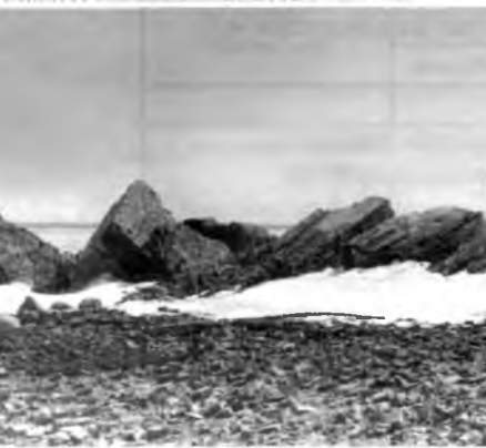
Остатки колокольни Ольхово