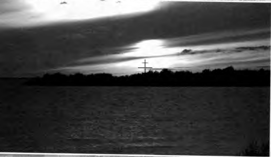
Поклонный крест на мысе