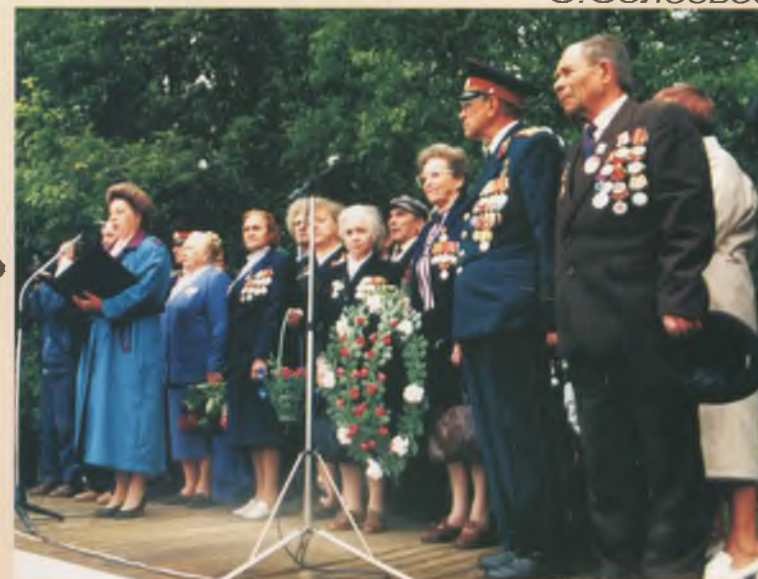
● Празднование 50-летней годовщины освобождения Ошты

В памяти хранится то, что свято, Только нам всего не рассказать: Можно ведь про каждого солдата Фронтовые повести писать... Честно прослужили мы Отчизне! Время! Время! Как тебя сберечь... Стали измерять дороги жизни Интервалом пятилетних встреч... С.Соловьев