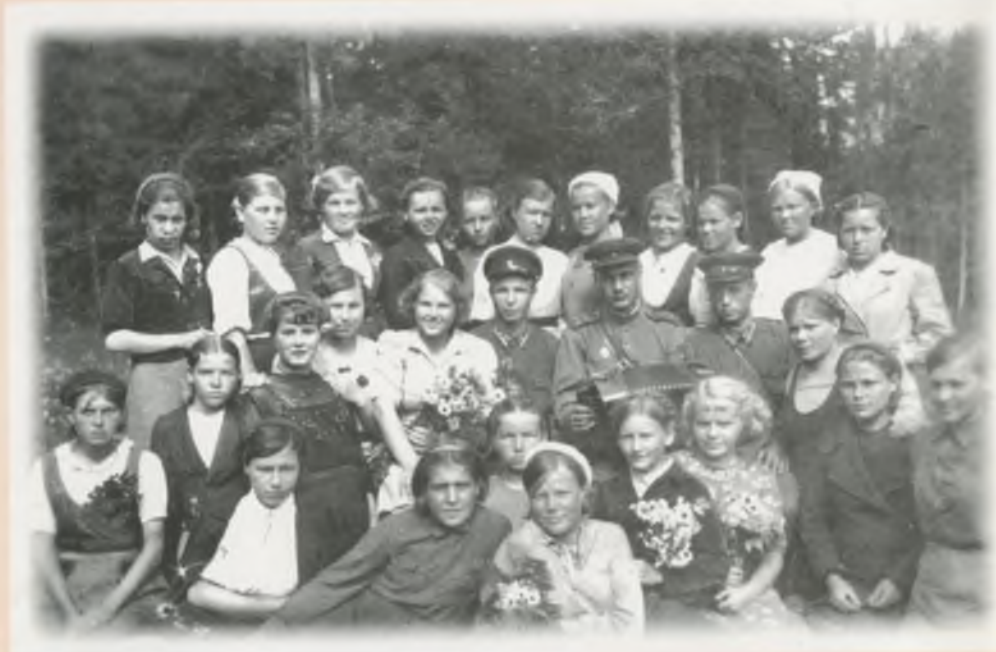
● Взвод минеров. Август 1944г.

1 сентября 1946 года эти важные для жизни села работы были завершены.