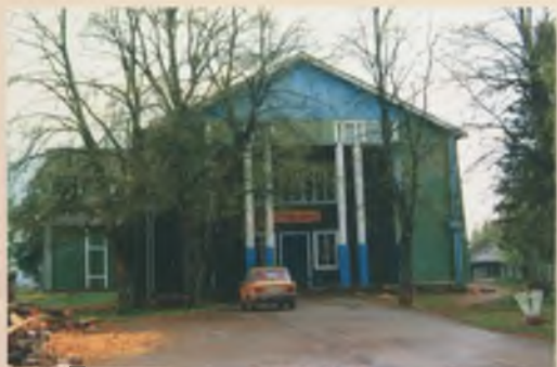
● Дом культуры

В 1708 г. Ошта вошла в Новгородскую губернию. В 1870 году здесь было создано впервые в России потребительское общество. С 1784 г. Ошта находится во владении Лодейнопольского уезда Олонецкой губернии. В 1906 г. в Оштинском приходе проживало 3300 человек.