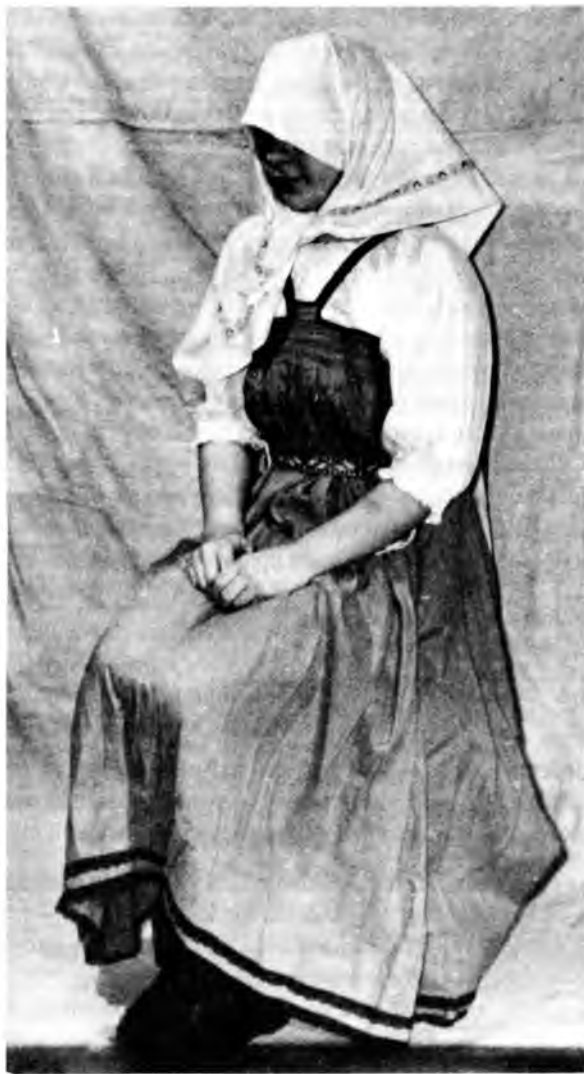
Сговоренка после просватания, в платке, повязанном «в нахмурочку». Деревня Аганино Пошехонского района Ярославской области

Не свою охотою. Все большою неволюю. Потакали весь род-племя. Выводил братец-батушка Он из горницы в горницу, Из столовой во светлицу, С середи в подокошечко. Он сдавал гостям на руки, Одному гостю навеки: «Ты владей, владей, милый зять, Матушкой моей милой, Сестрой Марией Ивановной. Все ко мне-то, да красной девушке, — Буйной головы да пебедители, Ретиву сердцу да огневители, Трубчатой косы да расплетатели, Вольной волюшки да разорители. Девьей красоты да отгонители! Ох-ти мнешеньке, горе тошнихонько! Отворочу свое лицо белое От столов-то да от дубовых, От скатеричек да от бердчатых, От своего-то да красна солнышка, От родителя-то, сударь батюшки, От чужих-то да людей добрыцх! Приворочу свое да лицо бело Ко кирпичней да жаркой печеньке, Ко своей-то да осподарыне, Ко желанной-то я да мамушке. Я скажу тебе, да осподарыня, Ты желанна да моя мамушка: «Я ходила, да красна девица, Ко столам-то да ко дубовым, Ко чужим-то да людям добрым, Ко своему-то да красну солнышку, Ко родителю-то я ко батюшку. Не взошло да красно солнышко, Не пригрело да ретиво сердце — Не пожалел меня да красно солнышко!»