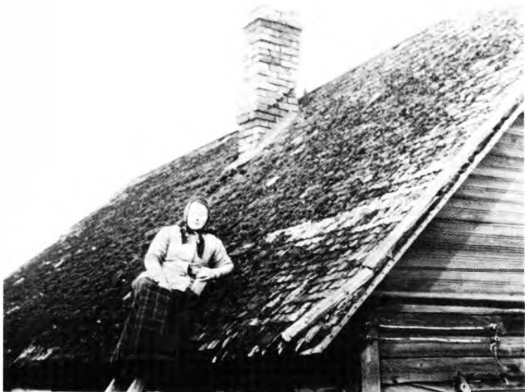
Девушка, сидя на крыше, закликает весну. Воспроизведение обряда

Закличек было много. Накричавшись (говорить заличку нужно было громко, чтобы весна услышала), наигравшись с «жавороночками», ребята засовывали их под застрехи в сараях, под крыши домов, прикрепляли к веткам деревьев. Оставшиеся печенье съедали и скармливали его скоту.