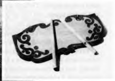
Барabanка (колл. МАЭ РАН; 236-1. Костромская обл.)