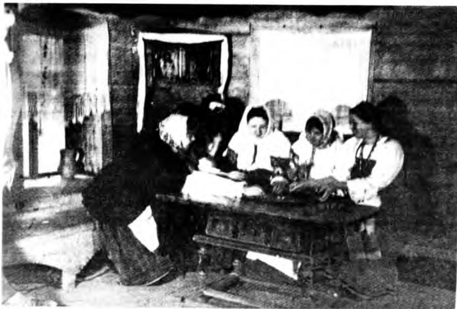
Девушки гадают. Воспроизведе- ние обряда

«Кому вынется — тому сбудется, тому сбудется, не минется»; «Кому поем — тому добро!»; «Слава!», «Илею!», «Лилелю». «Лады, лады!» и т.п.