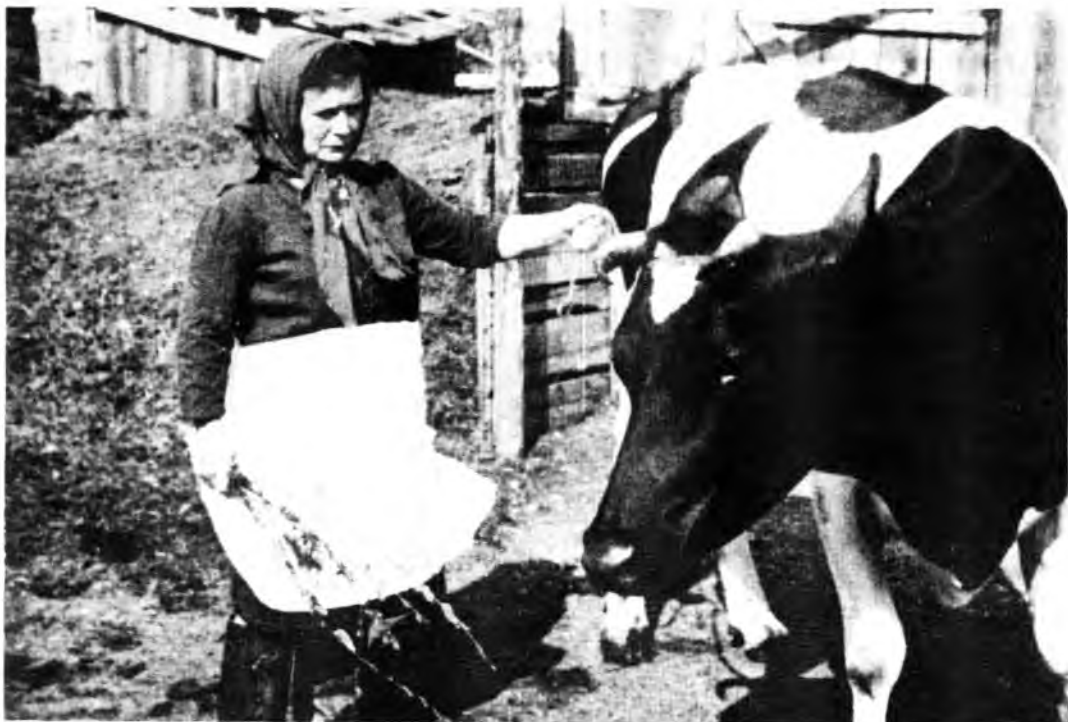
Утром в Егорьев день хозяйка выгоняет скотину ветками вербы. Воспроизведение обряда