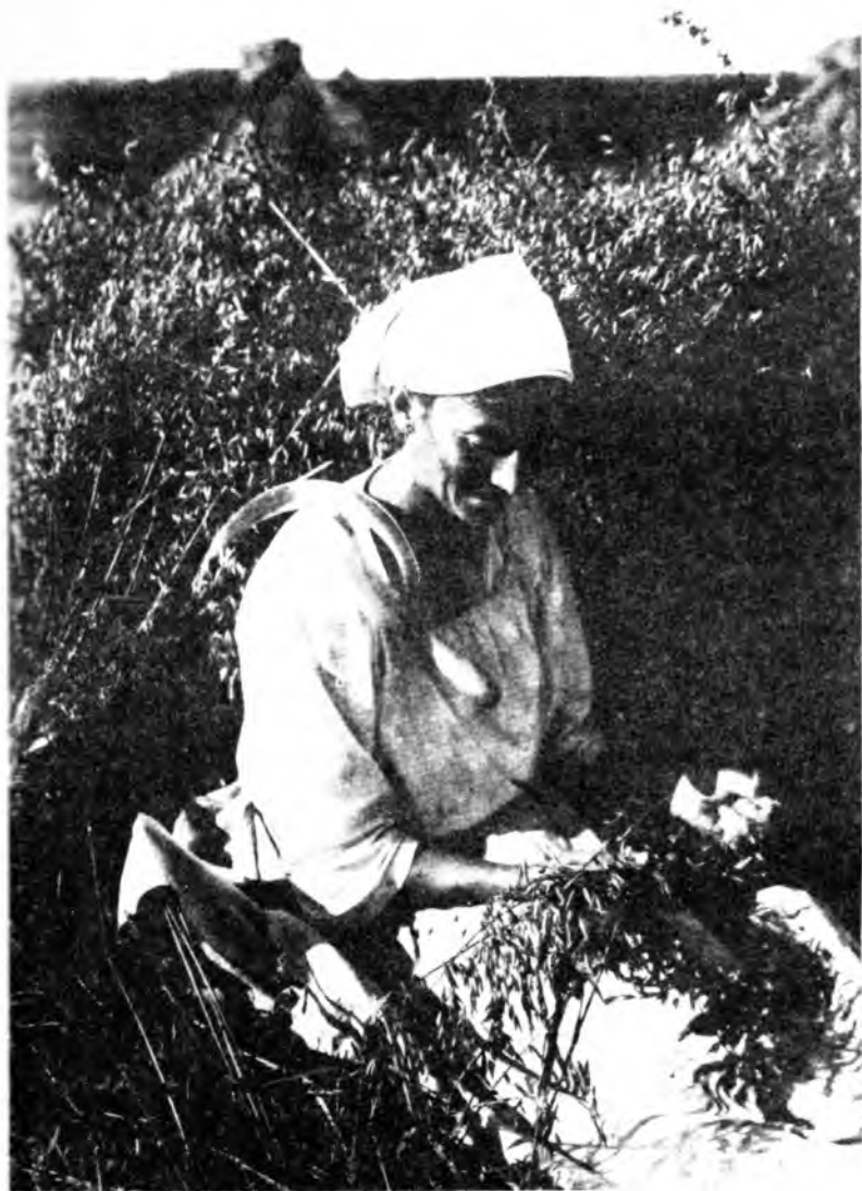
Жница во время отдыха гадает на овсяных колосьях. Ленинградская область (Колл. МАЭ РАН, И-1233-248)

Характерным для мелодики жатвенных песен был медленный темп исполнения, иногда в конце звуковой строки звучал высокий взглас «Гу», как и в весенних песнях.