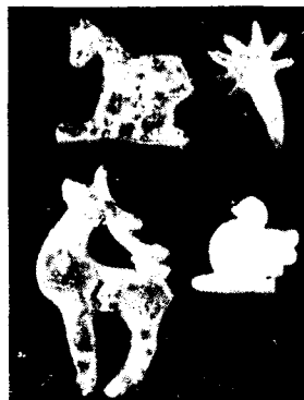
Рождественские козули. Архангельская область, Онежский район

* Припев повторяется после каждой строки.