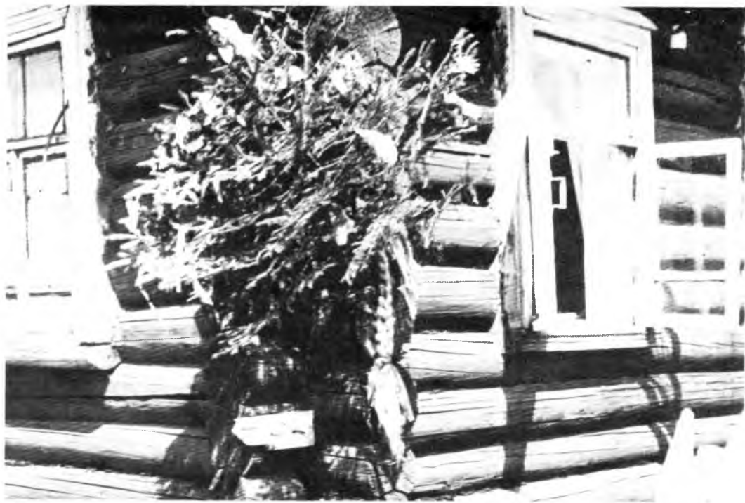
Елочка «Девья красота» на углу избы

Как сидели мы в беседушке, Да говорили — нонче замуж не пойдем, Говорили — нонче замуж не пойдем. Да а теперь у нас изменница, А теперь у нас изменница, Да изменила отца с матерью, Изменила отца с матерью, Да, во-вторые, сестер с братьями, Во вторые, сестер с братьями, Да а во-третьих, подруг милых, А во-третьих, подруг милых!