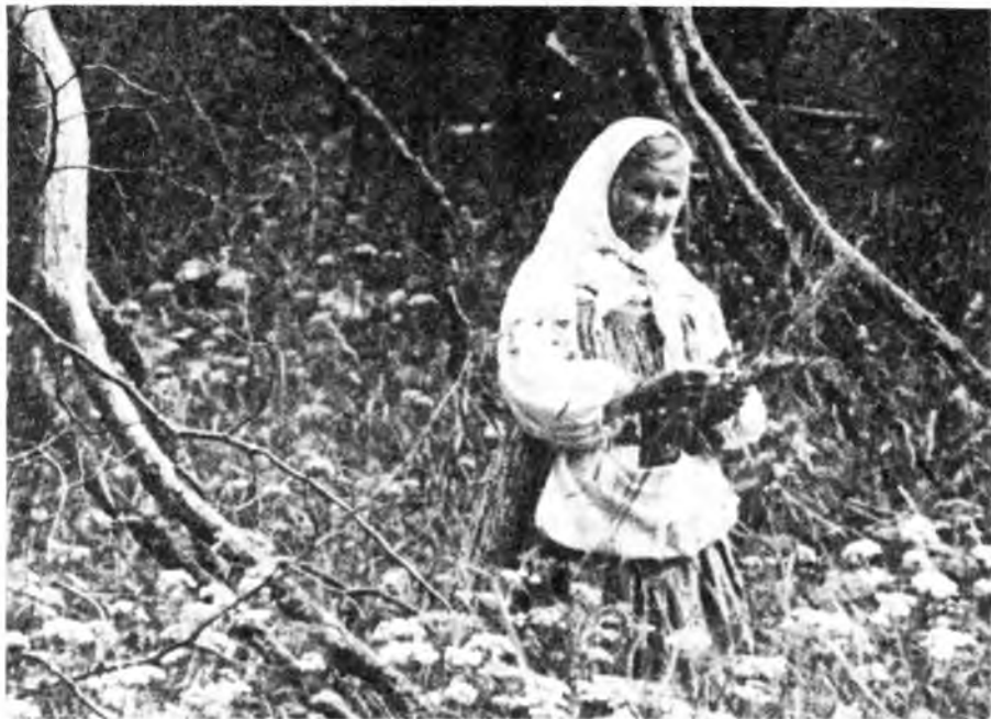
Сбор лекарственных трав в день Ивана Купала. Воспроизведение обряда

Но откуда взялось это странное название праздника «Иван Купала»?