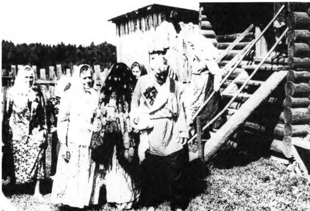
Вывод невесты из родительского дома перед поездкой в церковь. Воспроизведение обряда

302. Как у нашего князя Невеселые кони стоят, Они чуют путь-дороженьку По невесту ехать. — Ах вы, девушки-подруженьки! Уливайте гору крутую, Чтобы моему разлучнику Не взойти бы, не взехать! — Не грози, княгиня-душа! На крутую гору пеш взойду, Добра коня в поводу сведу. — Ах вы девушки-подруженьки! Запирайте вы вороточки Что тремя замками немецкими!