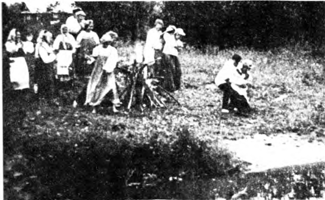
Гуляние в ночь на Ивана Купала. Воспроизведение обряда

год для лечения и ворожбы. Девушки собирали цветы для венков, чтобы в них идти на гулянье ночью, а потом гадать. Собирали двенадцать разных трав, чтобы положить под подушку — считалось, что тогда приснится суженый. Для этого говорили: «Суженый-ряженный, приходи в мой сад гулять», «Помогало» исполнению желания, если перелезут через двенадцать изгородей. Вероятно, число двенадцать как-то связывалось с числом месяцев в году — чтобы каждый месяц был счастливым. В течение дня хозяйки старались набрать побольше полыни, крапивы, чертополоха и воткнуть их в рамы окон, при входе в хлев, в дом, в конюшню, так как считалось, что в ночь на Ивана Купала вся «нечисть» — ведьмы, колдуны — особенно активизировалась. С ночью на Ивана Купала связано много легенд и «таинственных» историй.