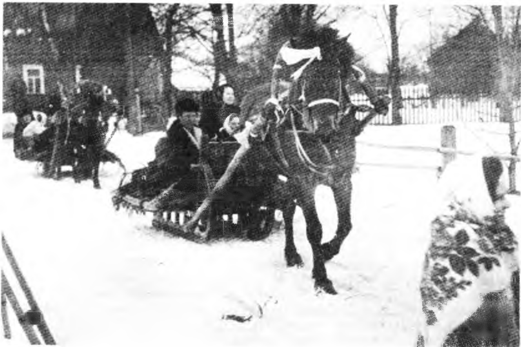
Катание молодоженов на лошадях. Воспроизведение обряда