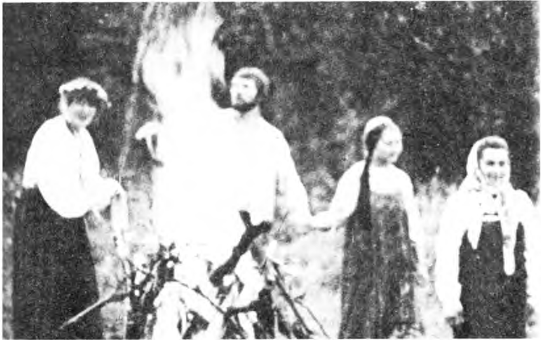
Костер в ночь на Ивана Купала. Воспроизведение обряда

168. Марья Ивана, Марья Ивана, В жито звала Марья Ивана: «И пойдём-ка, Иван, Пойдём-ка, Иван, В наше жито! Пойдём-ка, Иван!