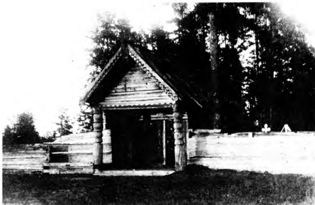
Кладбище в деревне Межеги. Олонецкая губерния. Колл. МАЭ РАН, № 1363-107

Если соседи пытались унять, утешить вдову, она просила не мешать ей причитать и так выплакать свое горе, и просит соседей помочь ей жить без мужа дальше. На что одна из присутствующих соседок «отвапливает», отвечает, что они никогда не оставят ни ее, ни ее детей, обращаясь к покойнику, как бы дает в этом клятву, одновременно прося его на том свете передать привет ее родным. Только на время отпевания умолкают вопли, а потом вдова опять начинает причитать, благодарит священника и всех, кто участвовал в отпевании, что хорошо отпели и помогли душе ее мужа.