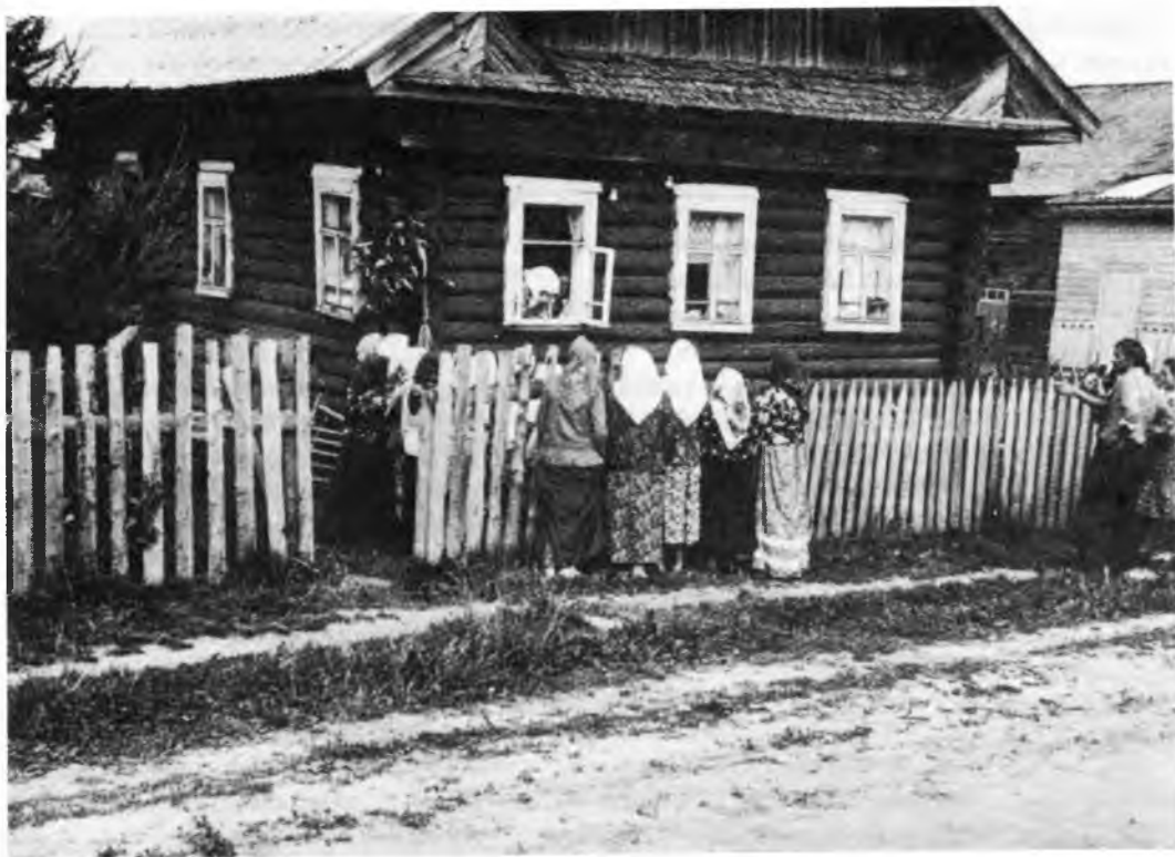
После рукоблтия девушки под окнами дома невесты заводили песни. Невеста, сидя у окна, начинала причитать. Воспроизведение обряда

Переступив через порог, сваты начинали разговор особым приговором. В Андреапольском районе Тверской области вели такой разговор: «Мы приехали не лапти плести, а родню завести». Отец девушки отвечал: «Не знаем, как наша невеста, в каком она согласии». В Нейском районе Костромской области можно было услышать следующее: «Нет ли у Вас телочки продажной?» — «Есть телочка, да больно молодая!» — «Вот и хорошо, нам и нужна молоденькая!»