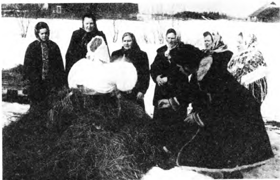
Проводы Масленицы. Поджигают чучело. Воспроизведение обряда

рое называлось «Прощеное», до 12 часов ночи. В этот день было принято всем просить прощения: детям у родителей, родителям друг у друга, даже крестьянам у помещика. Это не мешало общему веселью.