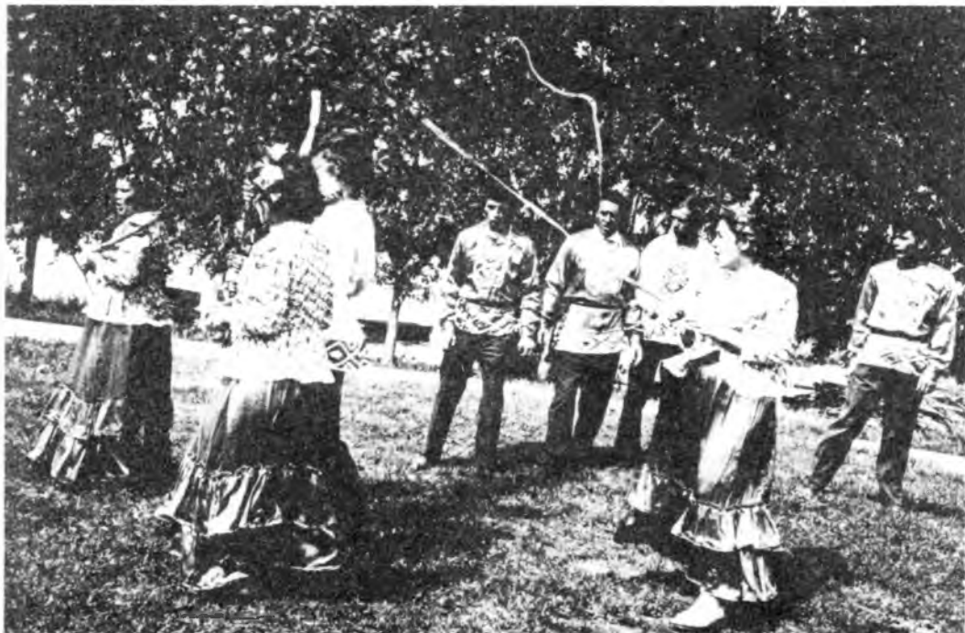
Девушки и парни несут березку из леса в деревню. Воспроизведение обряда

игре движениями показывалось, как лен сеяли, пололи, дергали, стелили, мочили, трепали, чесали, пряли. Припев песни «Ты удайся, удайся, мой лен» — остаток древнего заклинания. Сюда же можно отнести и игровую песню «А мы просо сеяли...», хотя в этой очень старинной песне прослеживается и древний, бытовавший когда-то обряд умыкания невесты парнем из другого рода.