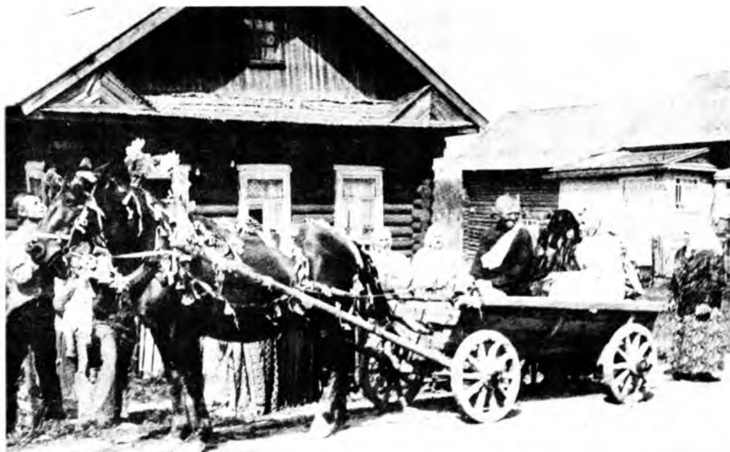
Свадебный поезд с невестой. Воспроизведение обряда

Коней свадебного поезда украшали лентами и звонками-громочками. Первыми в свадебном поезде ехали дружки и уже за ними — невеста с крестной матерью или свахой. От венца молодые ехали уже вместе. На пороге дома их встречали родители жениха, благословляли хлебом, солью и иконой, а гости осыпали зерном и хмелем.