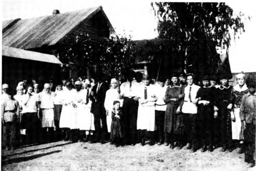
Идут с березкой в Троицу. Вятская губерния, 1929 год

березке. Яичница на Семик была едой обязательной, ритуальной. Яйцо как символ плодородия проходит через все весенние обряды. В конце XIX века на эту трапезу допускались уже и парни. После трапезы молодежь начинала вокруг березки водить хороводы, петь песни, играть.