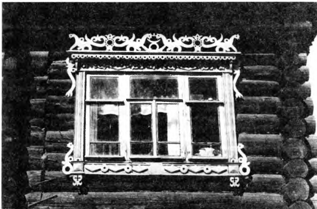
Резные наличники. Борисоглебский район Ярославской области

цев для службы в армии или мужчин на войну. Была и еще одна группа обрядов, специальных, связанных, например, с падежом скота, эпидемиями чумы, холеры, при сильных пожарах, но этих обрядов мы здесь касаться не будем.