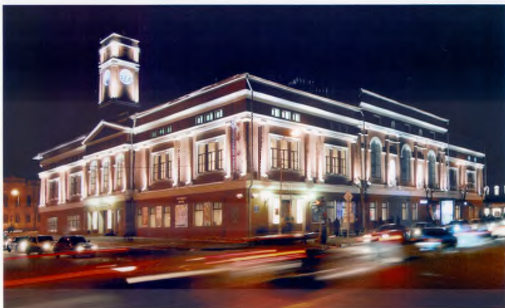
Череповецкий камерный театр

но судить о состоянии общества, о его нравственном здоровье. Вячеслав Позгалев в одном из интервью назвал театр «транслятором общественных процессов». И в самом деле, если на сцене засилье легких комедий, если театр занят только зарабатыванием денег в ущерб творческим поискам и экспериментам, а зритель воспринимает поход на спектакль лишь как веселое развлечение, значит, люди утратили потребность размышлять о вечном. И напротив, внимание к злободневным проблемам и глобальным вопросам бытия, интерес к мотивам человеческих поступков и тончайшим движениям души делают театр одним из важнейших очагов духовной жизни современного общества.