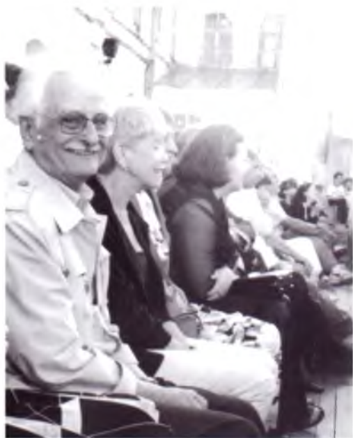
Народный артист СССР Марлен Хуциев – почетный гость V Российского театрального фестиваля «Голоса истории», 1999 г.

вологодских театров, отдельные актерские работы и творчество театральных художников. Так, Вологодский ордена «Знак Почета» государственный драматический театр неоднократно становился лауреатом фестиваля. Главными призами отмечены спектакли «Сон в летнюю ночь» (2003), «Дневник Анны» (2005), «Карамазовы и ад» (2007), «Эшелон»