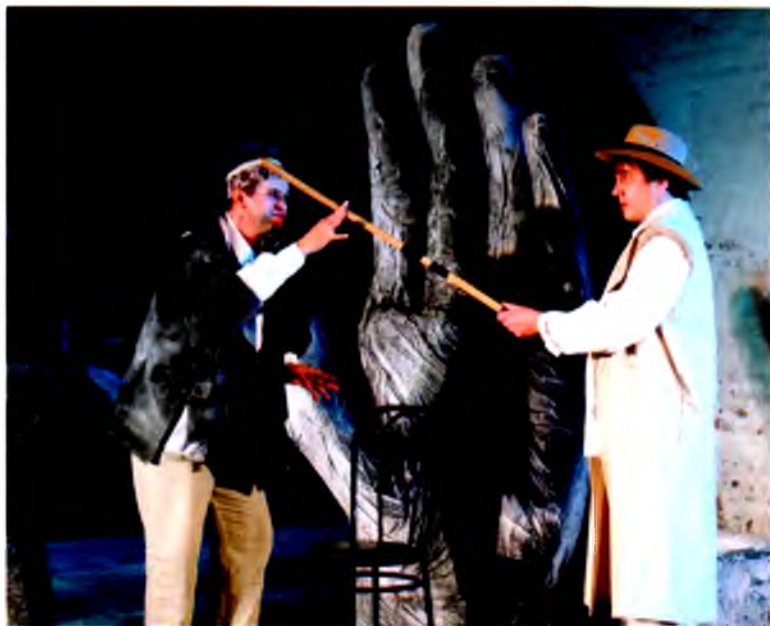
Сцена из спектакля «Забывать Герострата» Вологодского театра юного зрителя

занимает сегодня одно из ведущих мест в театральном пространстве страны. А между тем в середине 1990-х годов театр пребывал в состоянии творческого затишья. Эта ситуация не осталась незамеченной Губернатором области. Вячеслав Позгалев, будучи заядлым театралом и ценителем высокого искусства, выступил с инициативой «оживления» театральной жизни в Вологде. В 2001 году на должность художественного руководителя театра был приглашен молодой режиссер Зураб Нанобашвили.