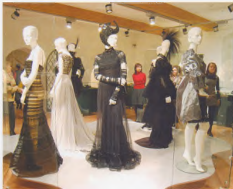
Выставка «Кружева. Валентин Юдашкин: 20 лет творчества в мире моды», 2008 г.

России. Вологда не случайно является местом проведения подобной выставки. В Вологодской области оказывается всесторонняя поддержка народным промыслам, сохраняется и развивается традиционная народная культура.