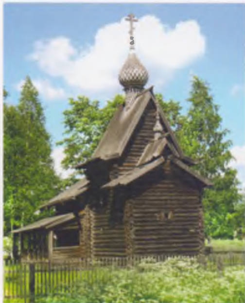
Церковь Ризоположения из села Бородава, 1485 г. Территория Кирилло- Белозерского музея-заповедника

В канун 50-летия открытия Музея-усадьбы Батюшковых и А. И. Куприна в селе Даниловском Устюженского района завершился комплекс ремонтно-реставрационных работ на усадебном доме – ныне объекте культурного наследия федерального значения. Дом был построен дедом поэта Константина Батюшкова еще в XVIII веке. Частым