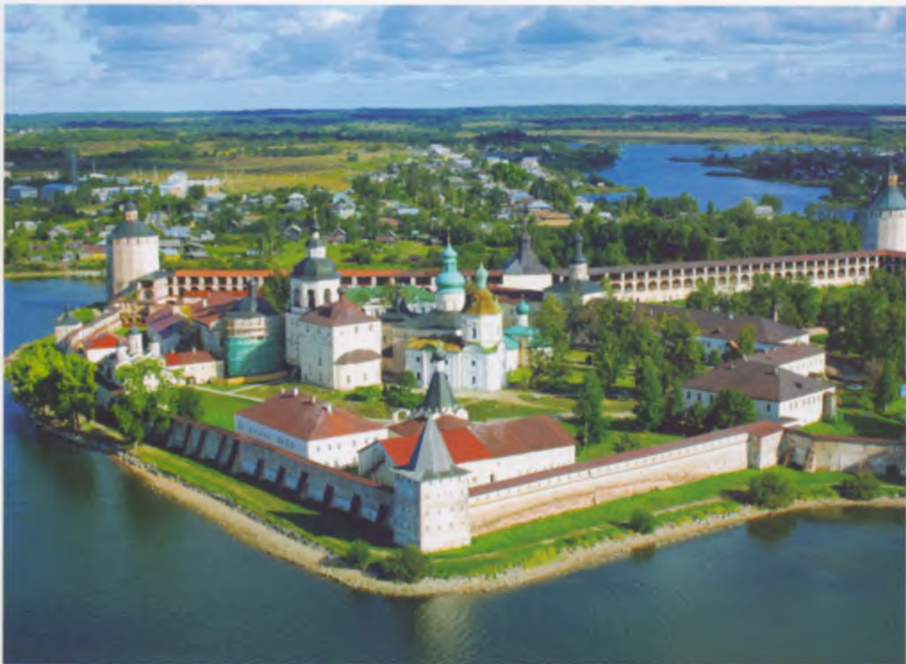
Ансамбль Кирилло- Белозерского монастыря, XV–XVIII вв.

Памятники должны жить... И они живут, сохраняя память об историческом прошлом и активно включаясь в современную культурную жизнь. Бывшие особняки, усадьбы, храмы преобразуются – в старых стенах вновь раздаются звуки шагов, слышны го-