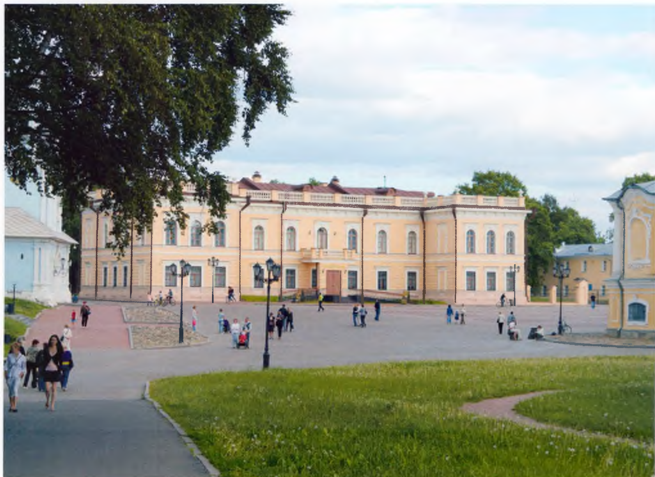
Вологда, Музей кружева