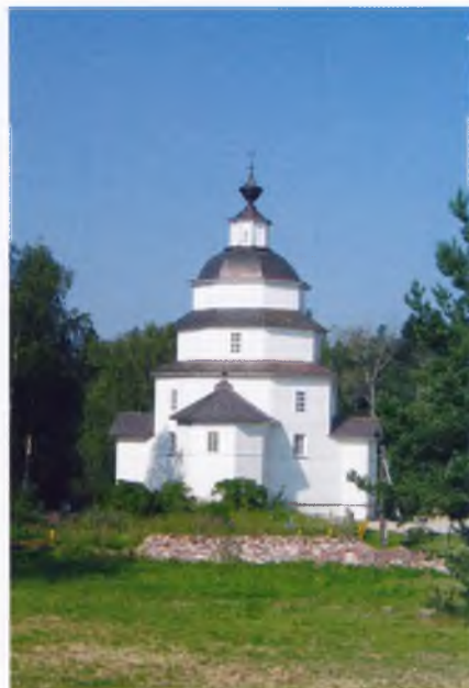
Ильинская церковь на Цыпином погосте, 1755 г. Кирилловский район

Важность этих событий была высоко оценена на государственном уровне. Авторскому коллективу проекта «Со-