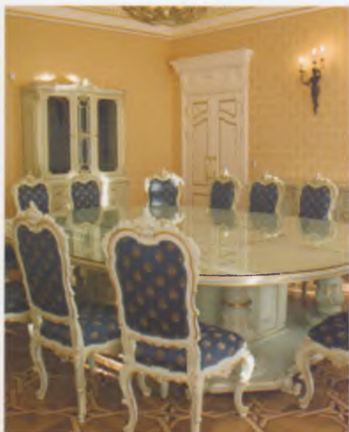
Интерьер Губернаторского дома, памятника истории и культуры конца XVIII в.

В январе 2010 года в селе Покровском Грязовецкого района состоялось торже-