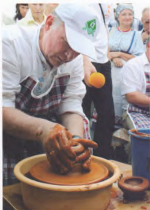
Губернатор области Вячеслав Позгалев на фестивале фольклора и ремесел в рамках ярмарки «Российские губернаторы в глубинке», Харовск, 2010 г.

Культурному, социальному и экономическому развитию территорий призвана способствовать региональная инициатива «Российские губернаторы в глубинке». В рамках этого проекта ежегодно в одном из районов Вологодской области проводится ярмарка, которая дает мощный импульс дальнейшему развитию района, расширению торгово-экономических и культурных связей.