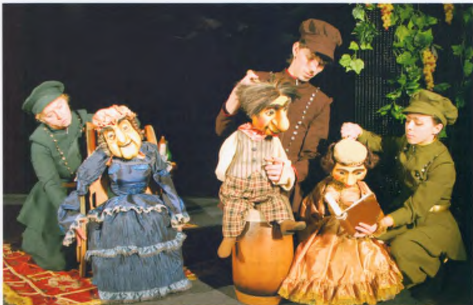
Спектакль «Ханума» Театра кукол «Теремок»

Рассуждая о современном театре, Губернатор Вячеслав Позгалев сказал: «Мы ставим задачу расширения театральной деятельности. Для этого нужны новые творческие решения, может быть, развитие малых театральных форм, и мы будем поддерживать такие идеи». В Вологде появились негосударственные театры. С 1999 года ведет отсчет своей – уже весьма богатой! – истории Камерный драматический театр. В 2009 году заслуженным артистом России Всеволодом Чубенко создан «Свой театр».