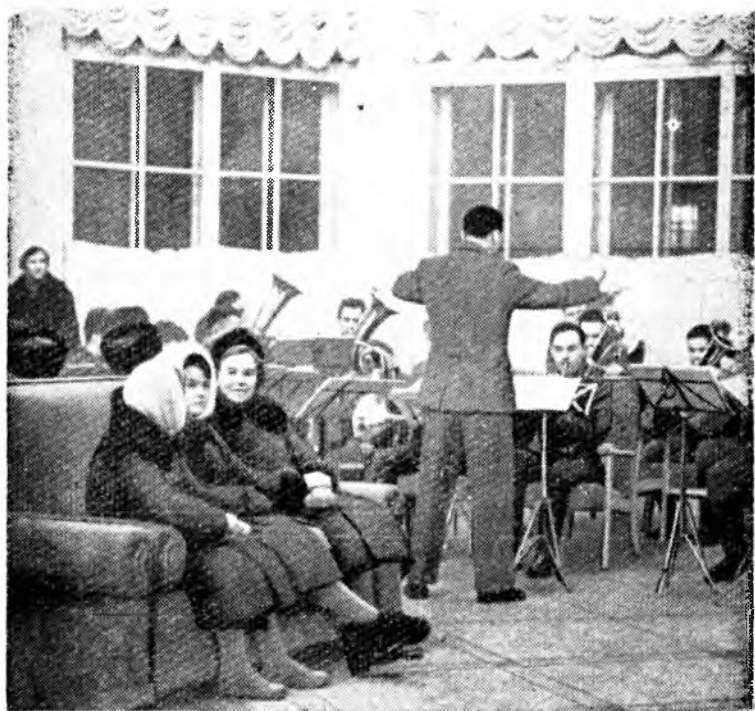
В фойе кинотеатра выступает духовой оркестр