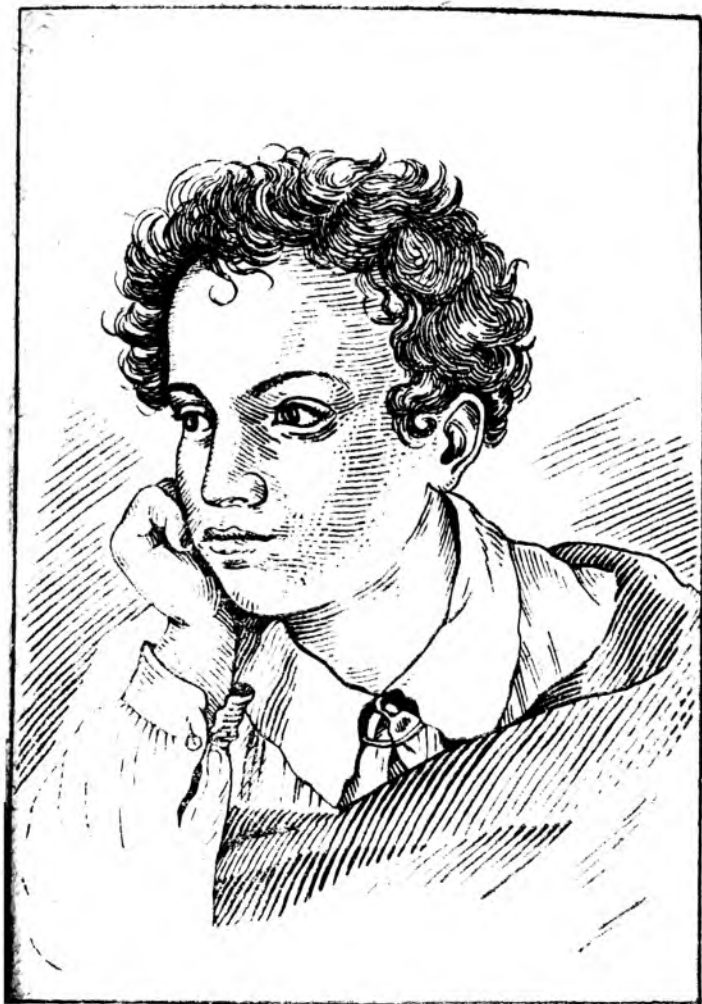
Пушкин — юноша (по гравюре Гейтмана)