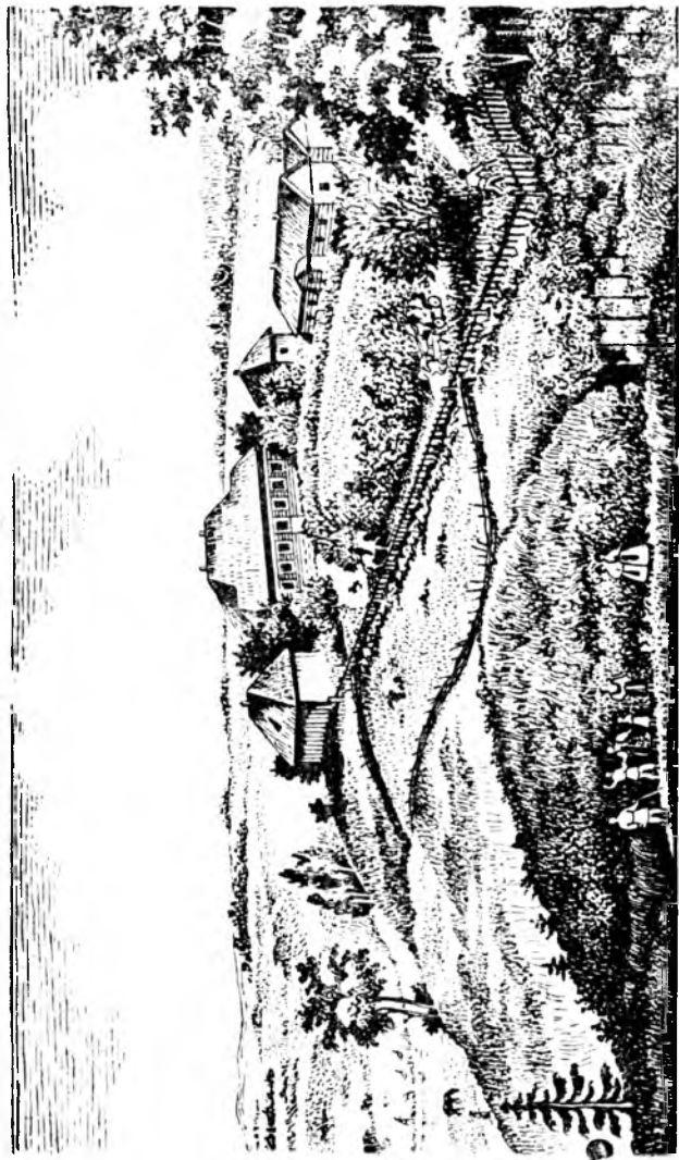
Село Михайловское (по литографии 40-х годов)