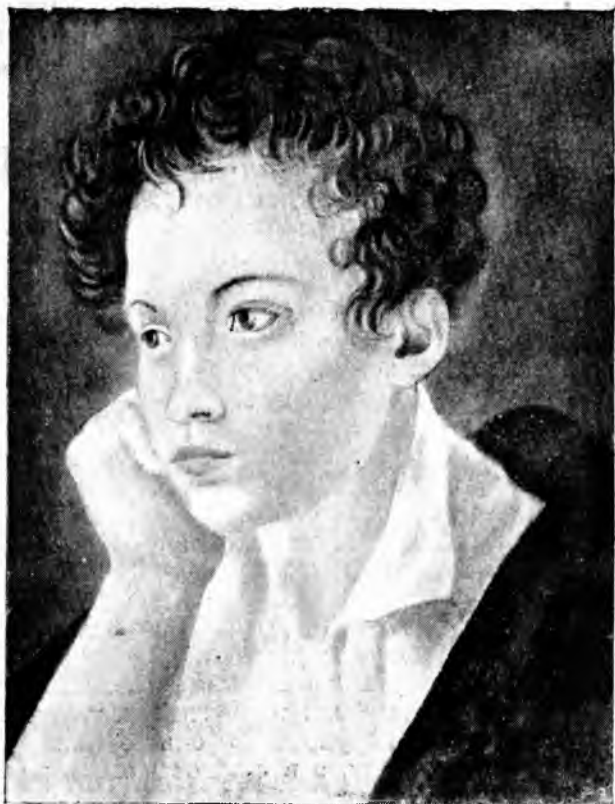
А. С. Пушкин. С акварели неизвестного художника.