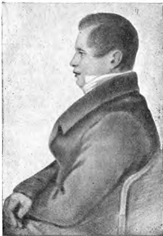
И. И. Пушкин.