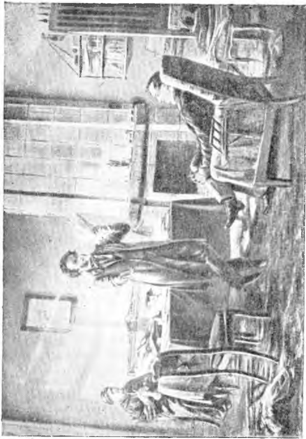
Пушкин и Пущин в селе Михайловском.