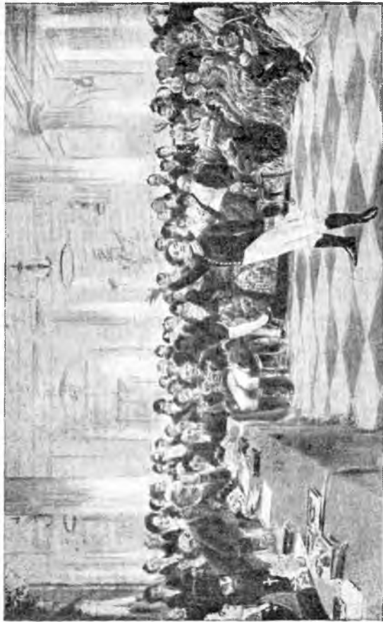
Пушкин на экзамене в Лицее.