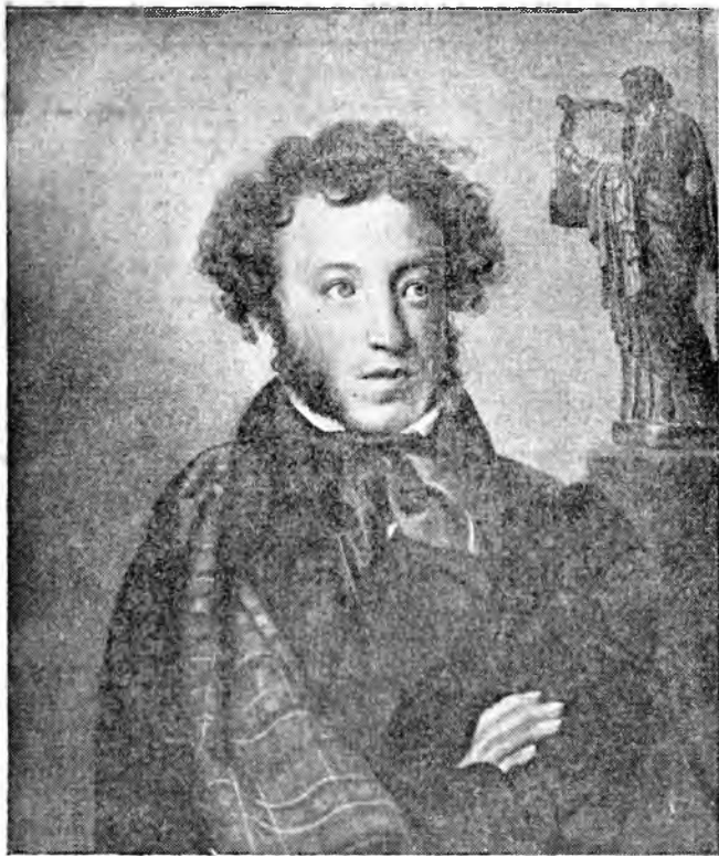
А. С. Пушкин. С портрета работы О. Кипренского.