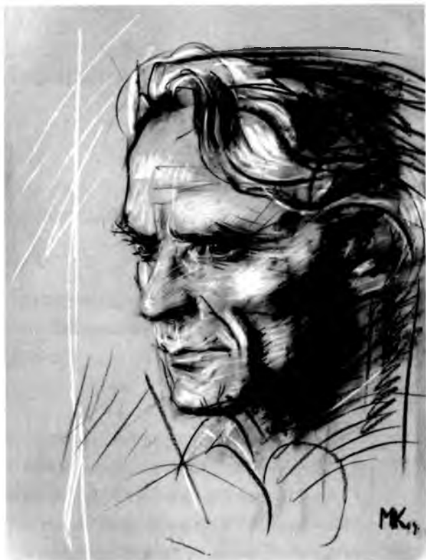
Рисунок Михаила Копьёва, 2009. Бумага, пастель, уголь, мел