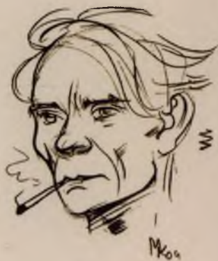
Рисунок Михаила Копьева, 2000 г.

Из авторского предисловия к книге «Молитвы времени разлома».