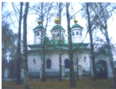
Воскресенский собор стр. 19