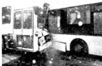
Авария автобусов Фото - эксклюзив