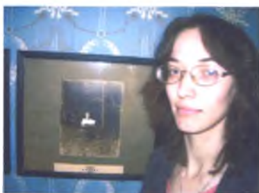
Потомки Северянина на юбилее поэта (стр. 32)