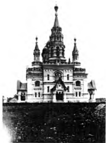
Спасский собор в селе Кукобой

Благоустройство территории храма. Заасфальтированы все подъезды к храму, установлена небольшая деревянная ограда с тре-