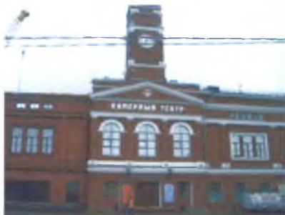
Череповцу 230 лет стр. 23