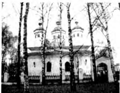
Воскресенский собор в Череповце