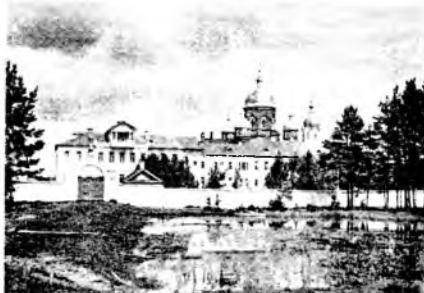
Леушинский монастырь (фото начала XX века)