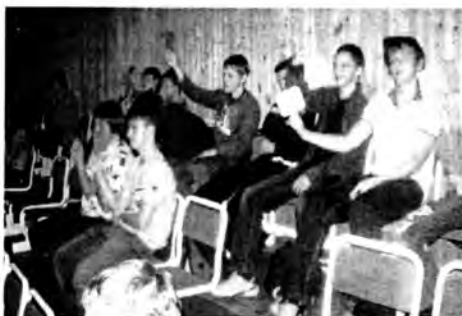
Призывники, а вы будете уклоняться?