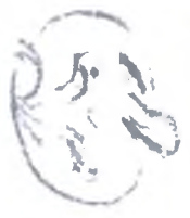
Далее в номере: статья И. А. Даниловой «Историческое литературоведение»

И могу торжествовать над всем. Разбивая эти вот экраны Один за другим или в Произвольном порядке, Это уж как заблагорассудится Мне, и только мне, Торжествовать, от души, не стесняясь Никого (Господи, а кого мне стесняться?!), Пачкая этот мерзкий вылизанный пол Всеми доступными мне средствами, Торжествовать, плюя в мутные лица И пробуждая в них недоумением Жизнь – да, жизнь! Я счастлив, видя, как этот Проклятый мир катится в тар-тарары, Увлекая за собой всех своих Довольных им обитателей, Катится и расчищает место для Всего нового, что останется, когда Эта гора обломков распадется На части, Того нового, что пока таится во тьме, Но явственно и четко очерчено, Что грядет в недалеком будущем И, я уверен, прочно займет Место на этой планете.