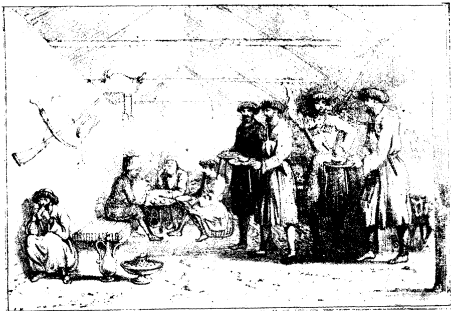
В кунацкой (рисунок из кн.: Longworth J. A Year among the Circassians. L., 1840)

В случае отсутствия мужчин гостя могла встретить старшая женщина. Гостю помогали сойти с коня, снимали с него оружие, бурку и препровождали в кунацкую или гостевую комнату дома. У тушин, например, встретить гостя выходила вся семья. По обычаю, девушки или молодые невестки выносили шубу и, поздоровавшись с гостем, набрасывали ее ему на спину 8 . У армян Ахалцихского уезда было принято, чтобы красивая девушка или кто-нибудь из женщин снимал с гостя коши (обувь).