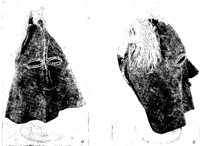
Рис. 2. Кожаная маска «водяного духа» у коряков-чавчуэнов: а — вид спереди, б — вид сбоку (ГИМ 78649 Е — 518)

келет мыслятся то как сверхъестественные существа, то как люди. Они то преследуют людей, то оказывают им содействие 13 .