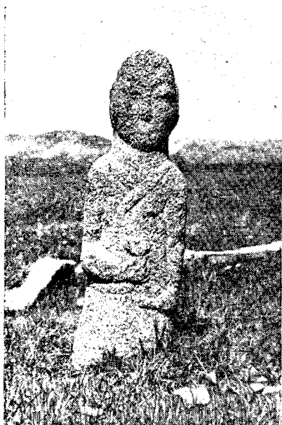
Рис. 1. Каменная баба с территории Хангай-сомона Арахангайского аймака МНР