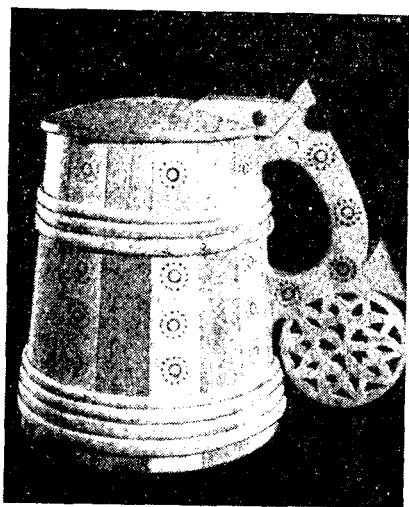
Рис. 5. Кружка для пива, резьба по дереву, работа мастеров объединения «УКУ», Эстонская ССР, 1971 г.

Национальных традиций придерживаются художники объединения «УКУ» в Эстонской ССР (рис. 5). Выполняемые ими изделия традиционны по орнаменту, колориту, техническим приемам исполнения. Но в этих изделиях учитывается их современное назначение, а поэтому созданная художниками вещь не является повтором старого, она представляет собой новое предложение, отвечающее требованиям современного человека.