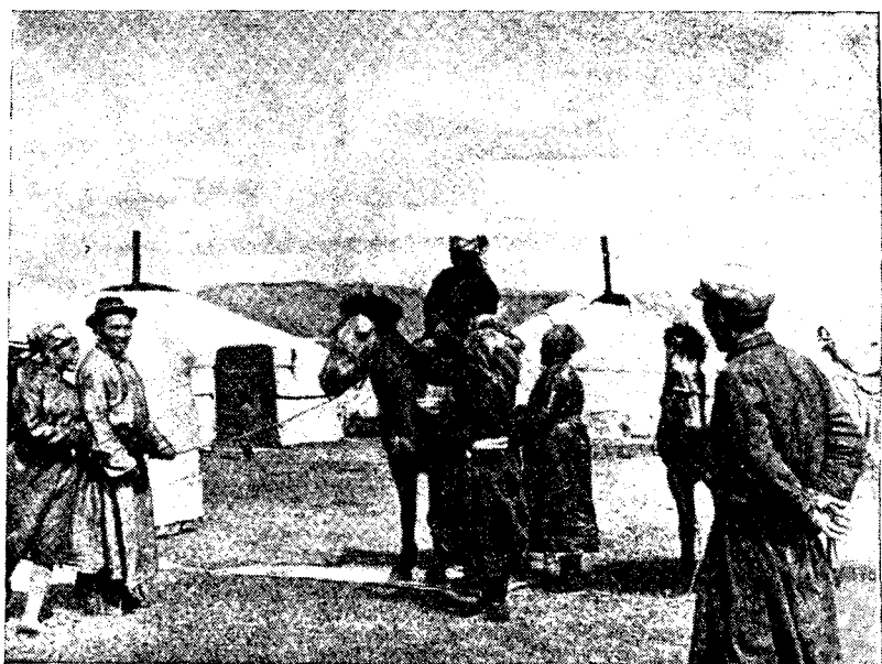
Рис. 2. Деталь свадебного обряда захчинов. Родственники жениха преподносят пиалу с молоком невесте, прибывшей со свадебным поездом в юрту жениха

Задачи, стоящие перед этнографами в МНР, огромны. Монголия — страна, где темпы создания нового уклада настолько быстры, что особенности традиционной кочевой культуры монголов исчезают прямо на глазах. Разумеется, степень внедрения нового в разных экономических зонах страны неодинакова. На востоке нередко можно встретить верблюдов, запряженных в деревянную, без единой железной детали, повозку — ту самую, которую можно увидеть на наскальных росписях бронзового века и которая до сих пор является наиболее распространенным средством передвижения и перевозки поклажи во время перекочевков. Однако на западе, в предгорьях Монгольского Алтая, где сомонные объединения полностью откочевывают 12 в горы на летний период и возвращаются на территорию центральной усадьбы сомона за несколько дней до начала учебного года, одними верблюдами уже не обойтись. Один за другим каменистыми горными дорогами проносятся с самых отдаленных кочевий к центральной усадьбе сомона грузовики с юртами, домашней утварью, детьми, и грохочущими на ходу бидонами и чайниками. Параллельно с ними чинно ступают по горным тропам навьюченные тем же скарбом верблюды, уже не запряженные в повозки, так как в безлесных западных районах деревянных повозок нет 13 . Три — пять дней требуется верблюду для перекочевки на расстояние в 80—100 км.