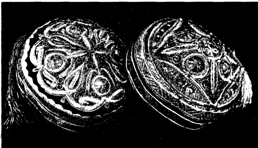
Рис. 2. Современные золотошвейные тюбетейки Бухарской фабрики «40 лет Октября», Узбекская ССР, 1971 г.

показывает, что за счет механизации непроизводительного труда в узорном ткачестве и ковроткачестве появляется возможность в самых различных вариантах выполнять сложные и разнообразные рисунки, а главное — создаются благоприятные условия для проявления творческих способностей мастеров.