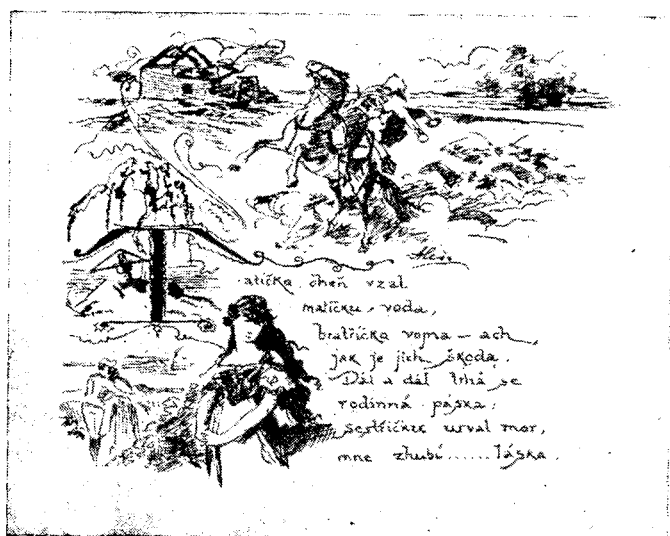
Рис. 2. Иллюстрация к песне: «Отец мой сторел...»

вам, узорам на одежде, ставнях, печах, пасхальных писанках, пряниках и т. д. Другое начало в значительной степени было создано самим художником, в процессе его работы над рисунками-песнями. Оно было подсказано Алешу самой природой. Очень часто, решая трудные задачи соединения текста и иллюстраций, а также и в декоративных целях, художник использует в «Шпаличке» стилизованные контуры сплетенных корней, выходящих и стелющихся растений, древесных ветвей и т. д. Однако