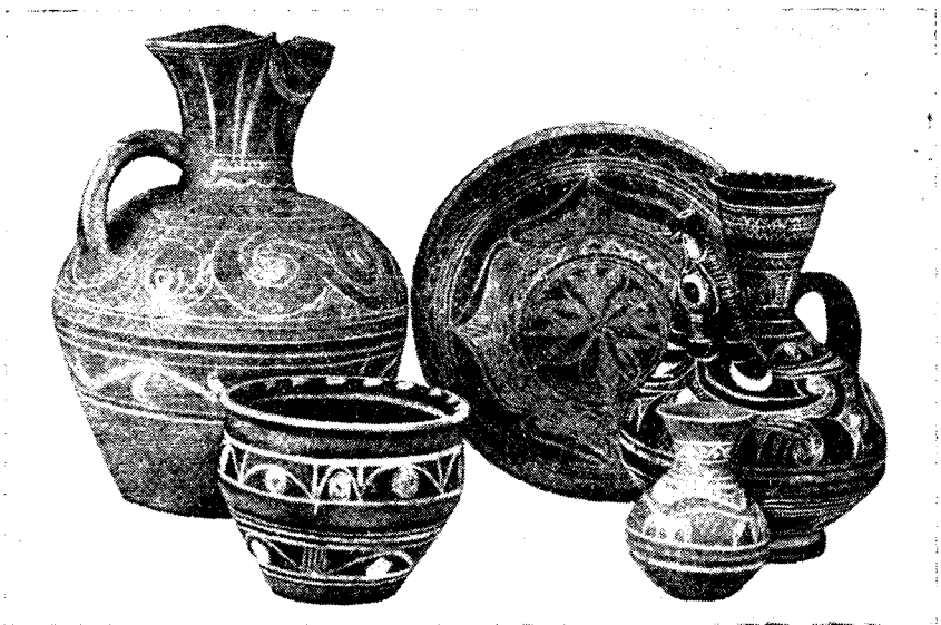
Рис. 3. Современные гончарные изделия селения Балхар, Дагестанская

основе традиций древнерусской живописи родилась и получила интересное развитие миниатюрная живопись Палеха, Мстеры, Холуя 8 . Традиции русских живописных эмалей продолжают мастера фабрики «Ростовская финифть».