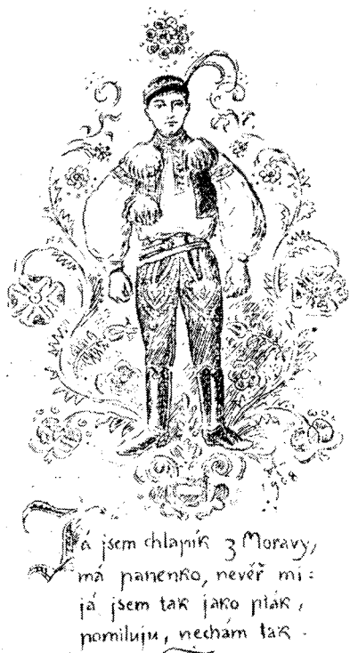
Рис. 5. Иллюстрация к песне: «Я, парень с Моравы...»

До середины XIX в. русский лубок в основном был больше связан с былинной, сказкой, притчами, повестями и разного рода присловиями, отмеченными фольклорным влиянием. Лишь во второй половине века появляются так называемые «простовики» (черно-белые картинки на грубой серой бумаге) на темы русских народных песен («Лучина, лучинушка березовая...», «Во лузях, во лузях...», «Ай во поле, ай во поле...», «Пряди моя пряха...», «Вниз по матушке по Волге...» и др.). Безымянные русские