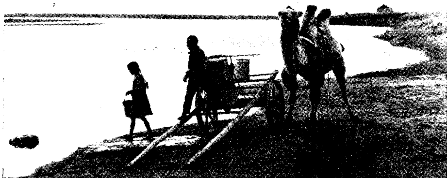
Рис. 3. Так ездят за водой жители долины Керулена

Но те семьи, чьи дети пойдут 1 сентября в школу, должны спешить — это им на помощь направлены все грузовики.