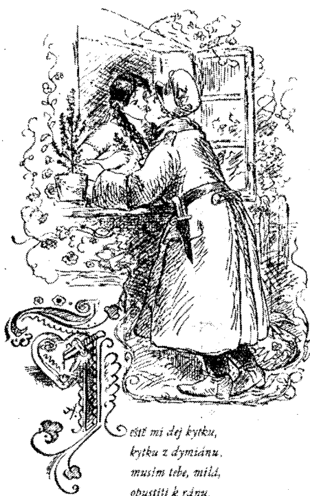
Рис. 3. Иллюстрация к песне: «Дай же цветочек, цветок дымиану, должен тебя, милая, покинуть к утру»

Метафоричность словесных образов Алеш с успехом возмещал, а точнее дополнял в своих рисунках выработанной им особой графической метафоричностью. В «Шпаличке» часто встречаются символы. Так, на иллюстрации к воинской песне «Дай же цветочек...» изображен солдат,