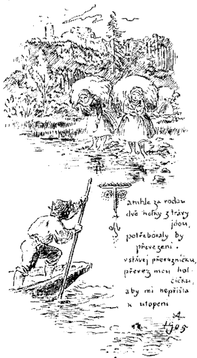
Рис. 4. Иллюстрация к песне: «Там за рекой две девушки с травой, надо им переехать, вставай перевозчик, перевези мою девушку, чтоб она не утонула»

Алеш заставляет зрителя дорисовывать в своем воображении иллюстрации к песням, усматривать в части целое. Поясные фигуры людей нередко вырастают в рисунках Алеша прямо из текста, круп лошади из орнамента, деревья изображаются без вершин и т. д. Во всех этих условностях, так же как и в иносказательности иллюстрированных образов Алеша, их смысловой многозначности, мы вправе видеть трансформацию условностей народного творчества как словесного, так и изобразительного. Можно было бы говорить и о других «графических тропах», созданных Алешем (аллегории, параллелизме, гиперболе, иронии), но и приведенные примеры убеждают в том, что в процессе иллюстрации песен художником была разработана соответствующая их народному характеру специфическая «изобразительная поэтика».