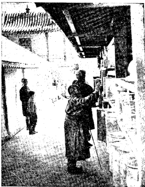
Рис. 5. Улан-Батор. Монастырь Гандантекчиг-линг. Покрутить молитвенные барабаны — долг каждого верующего и каждого туриста

Ламаизм в современной Монголии давно перестал быть той всеобъемлющей идеологической и культовой системой, которая регламентировала