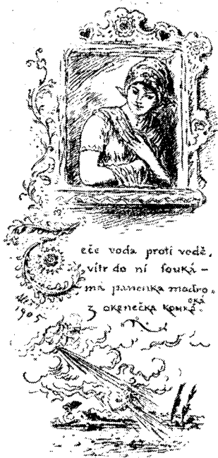
Рис. 1. Иллюстрация к песне: «Течет вода против воды, ветер на нее дует — моя синеглазая из окошка смотрит»

Очень важным компонентом рисунков-песен Алеша являются орнаментально-декоративные элементы. Они окаймляют изображения, встречаются и в виде так называемых розетов, а иногда сплошной сеткой заполняют свободное от сюжетных изображений пространство. Если попытаться выделить основные начала орнаментовки, то, очевидно, их будет два. Одно из них, пожалуй все-таки определяющее, явно восходит к чешской народной национальной традиции: вышивкам, резьбе по дереву, круже-