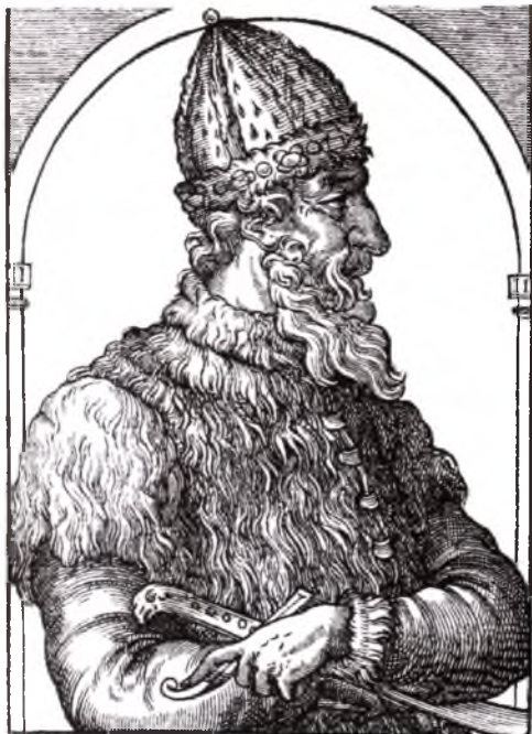
Великий князь Иван III. Гравюра из «Космографии» А. Теве. 1584 год