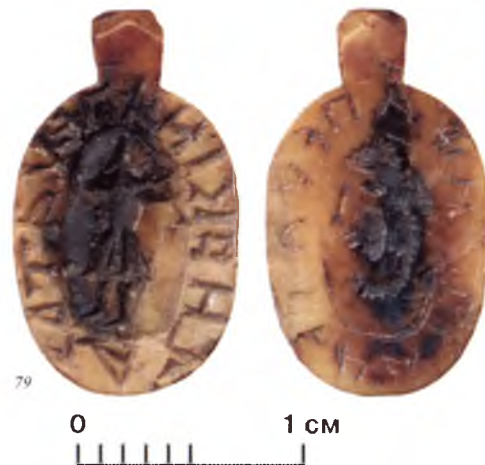
Прикладная печать-матрица из кости. XV век. На ее лицевой стороне изображение воина, в правой руке которого – поднятый меч, а в левой – щит. Рисунок окружен надписью «Печать Зазиркина». Любопытно, что на оборотной стороне печати сохранились следы разметки для другой печати, с изображением фантастического зверя, окруженного надписью «Печать Рато<...>ина» (Ратошина?). Найдена в 1992 году при археологических раскопках под руководством И. П. Кукушкина на Вологодском городище