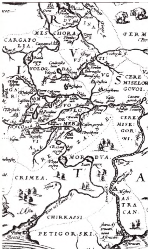
Фрагмент карты Московии Антония Дженкинсона (1562 год), основанной на русском «чертеже» 1497 года