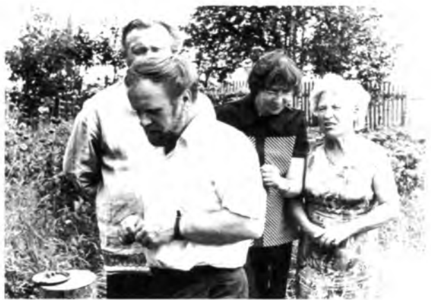
Семья писателей д. Тимониха, Вологодская область, 1970-е гг.

В библиотеке Музея-квартиры В.И. Белова хранится порядка полутора десятка книг В.П. Астафьева, девять из которых подписаны автором. Часть подписей датированы вологодским периодом.