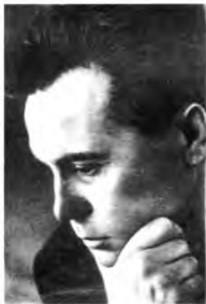
Профильный фотопортрет В.П. Астафьева, 1964 г.

«Исконно русская вологодская земля» пришлось Астафьеву по душе, «близкими» называл писатель и самих вологжан. Подтверждение этому мы находим в опубликованном письме 1969 года 14 : Вот и выбрал я старинную Вологду, где есть друзья и еще пахнет Русью, близкой моему сердцу. Пока мне здесь хорошо. Народ тут простодушнее, добрее, и природа сохранилась, и тихо тут, неторопливо. Дали мне такую же точно квартиру, как в Перми, только получше построенную, на три метра меньше, да это пустяки. Встретили меня хорошо и власти, и писатели.