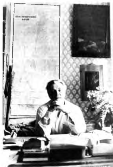
В.П. Астафьев Вологда, кабинет писателя, 1970-е гг.