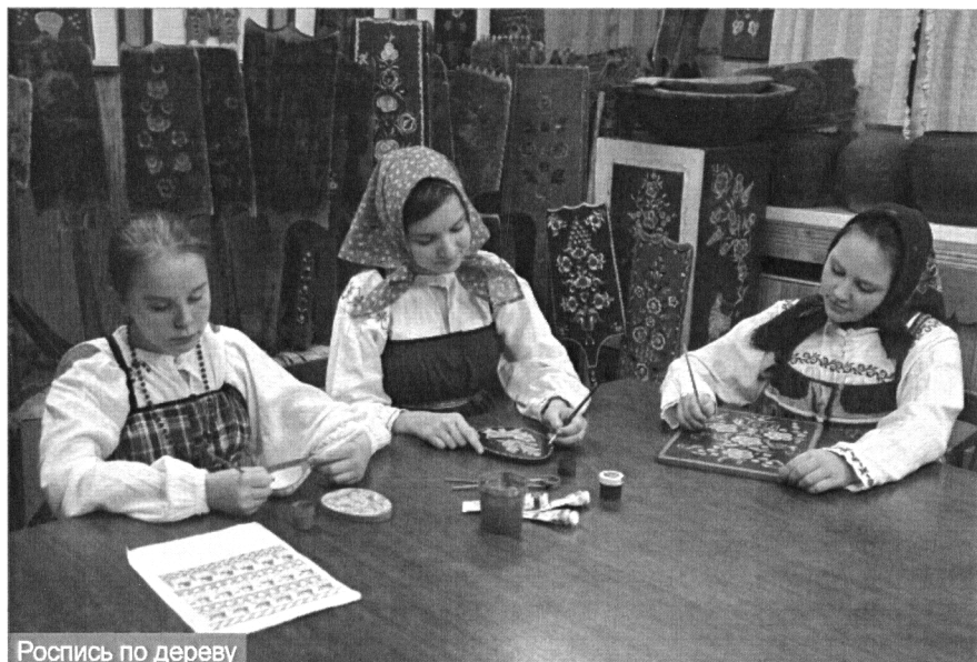
Роспись по дереву

– сопричастность русского крестьянина к миру как Вселенной.