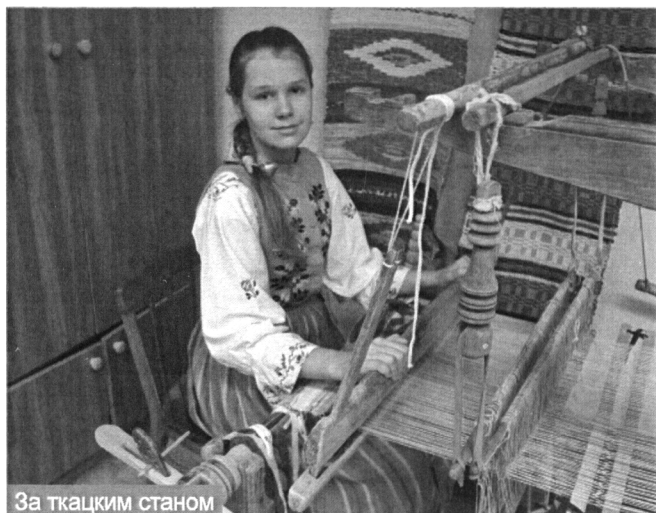
За ткацким станом